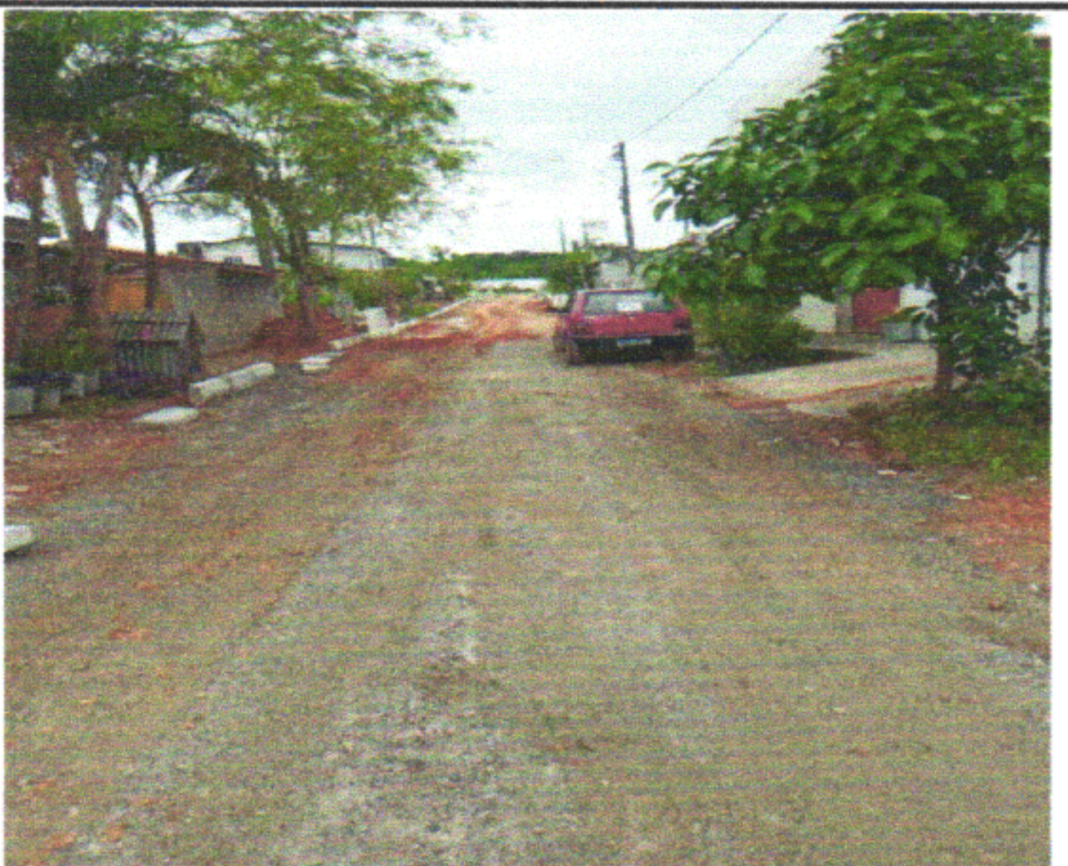
RUA DJANIRA DA FONTE