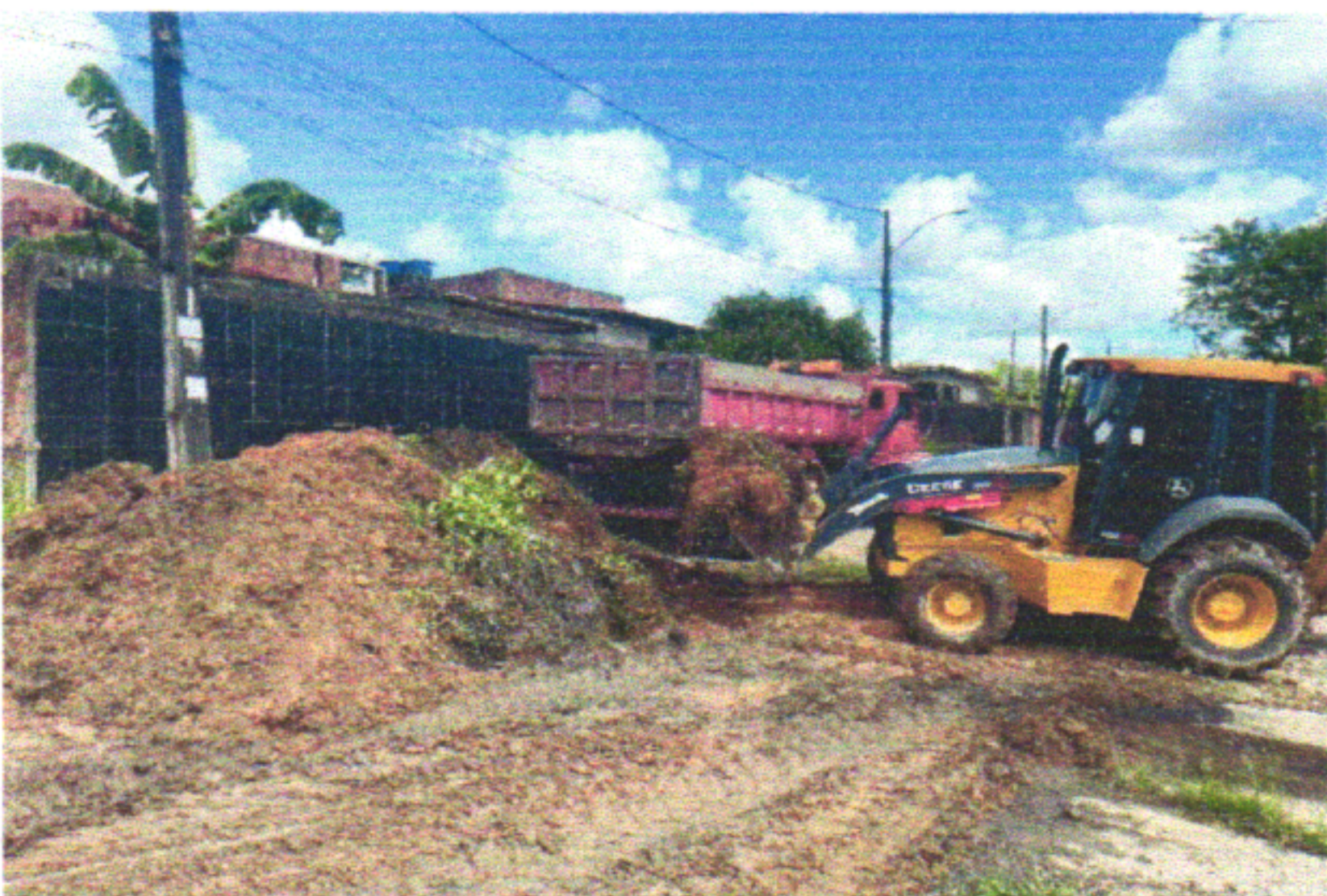
RUA EUGÊNIO CARDOSO DA FONTE