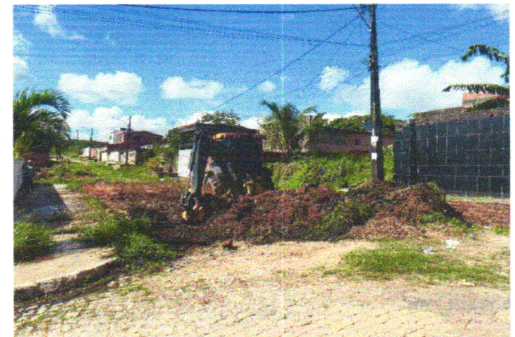
RUA EUGÊNIO CARDOSO DA FONTE