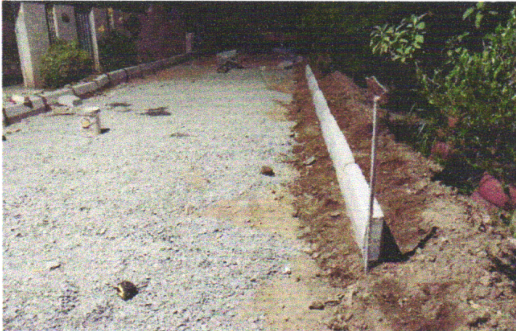
RUA JOÃO BEZERRA