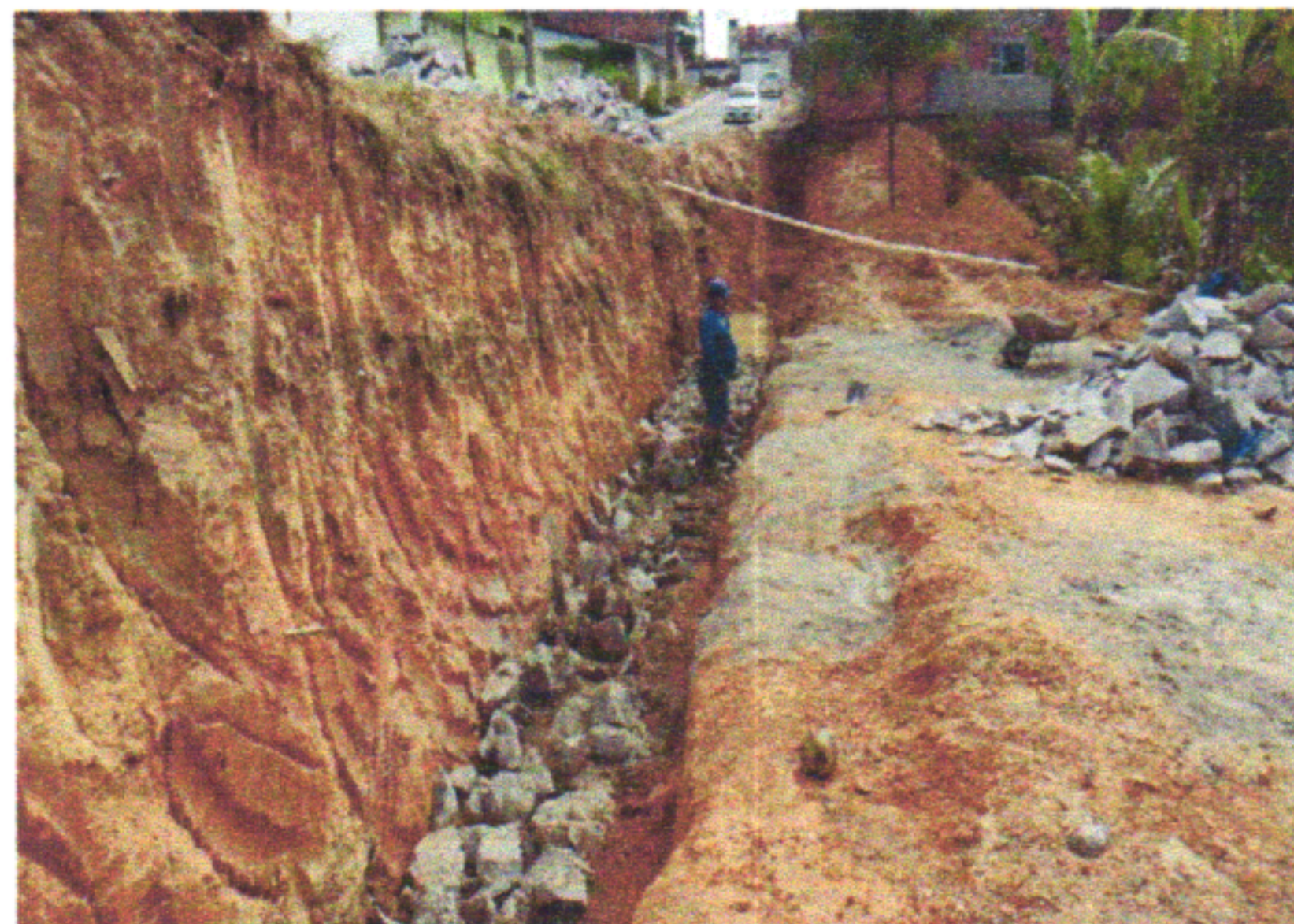
RUA MANOEL REIS