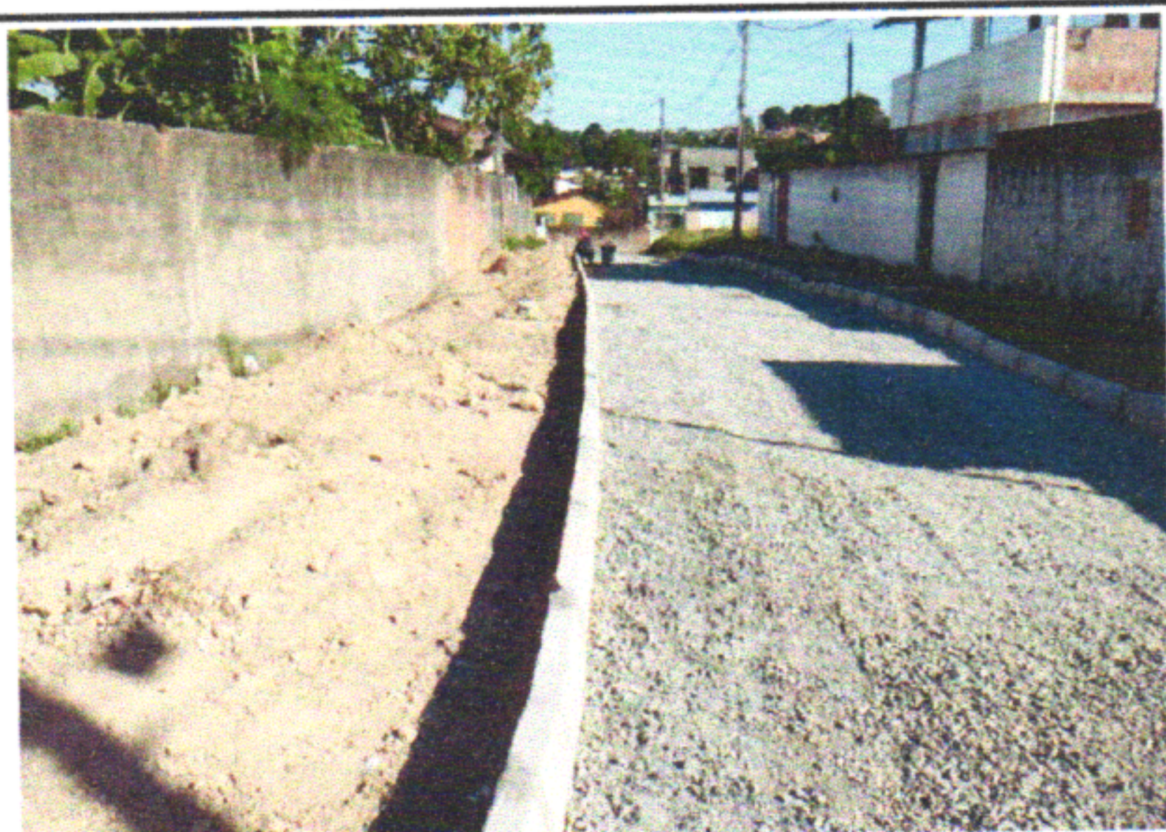
RUA PNFILE MONTEIRO DE QUEIROZ