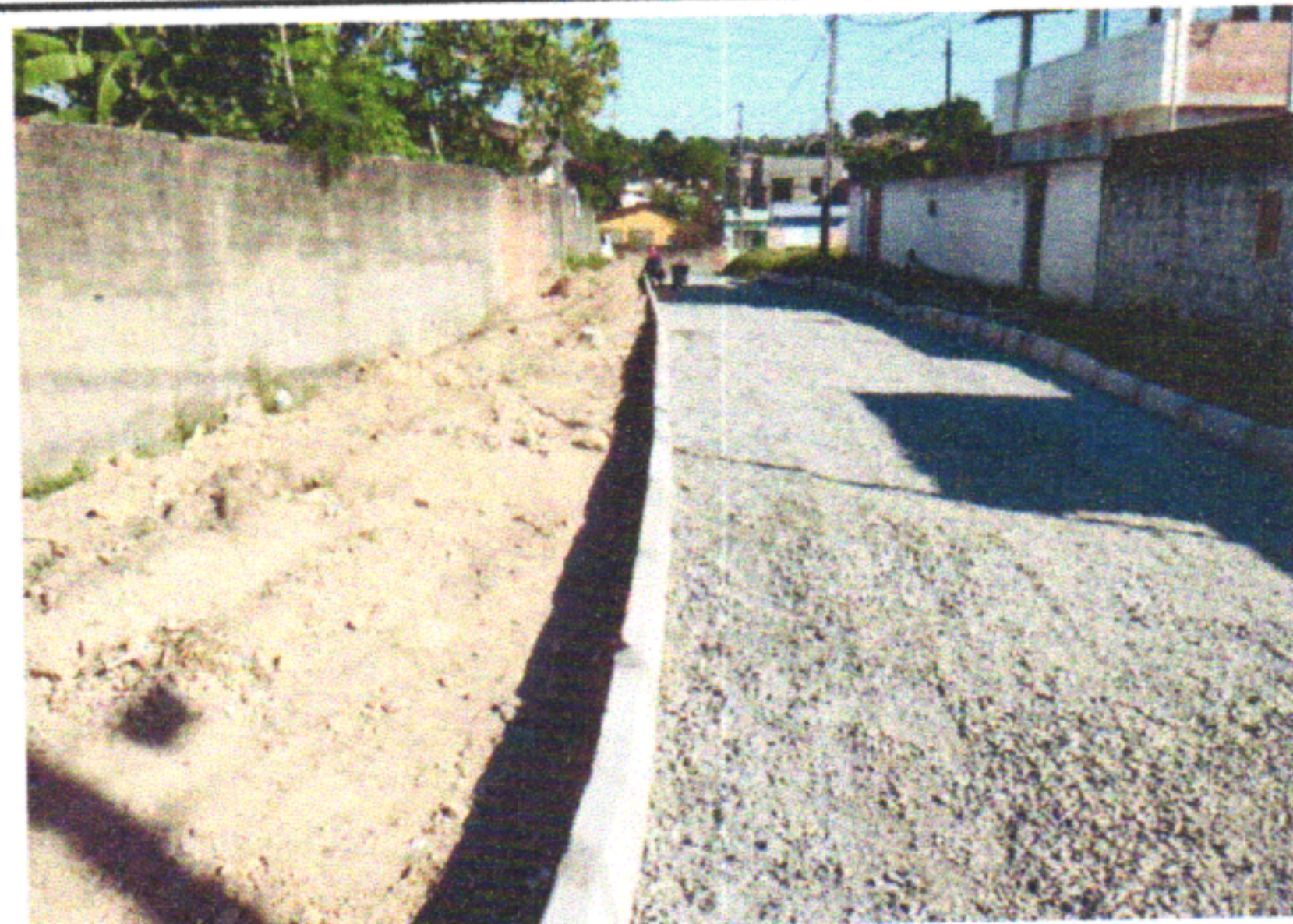
RUA PNFILE MONTEIRO DE QUEIROZ