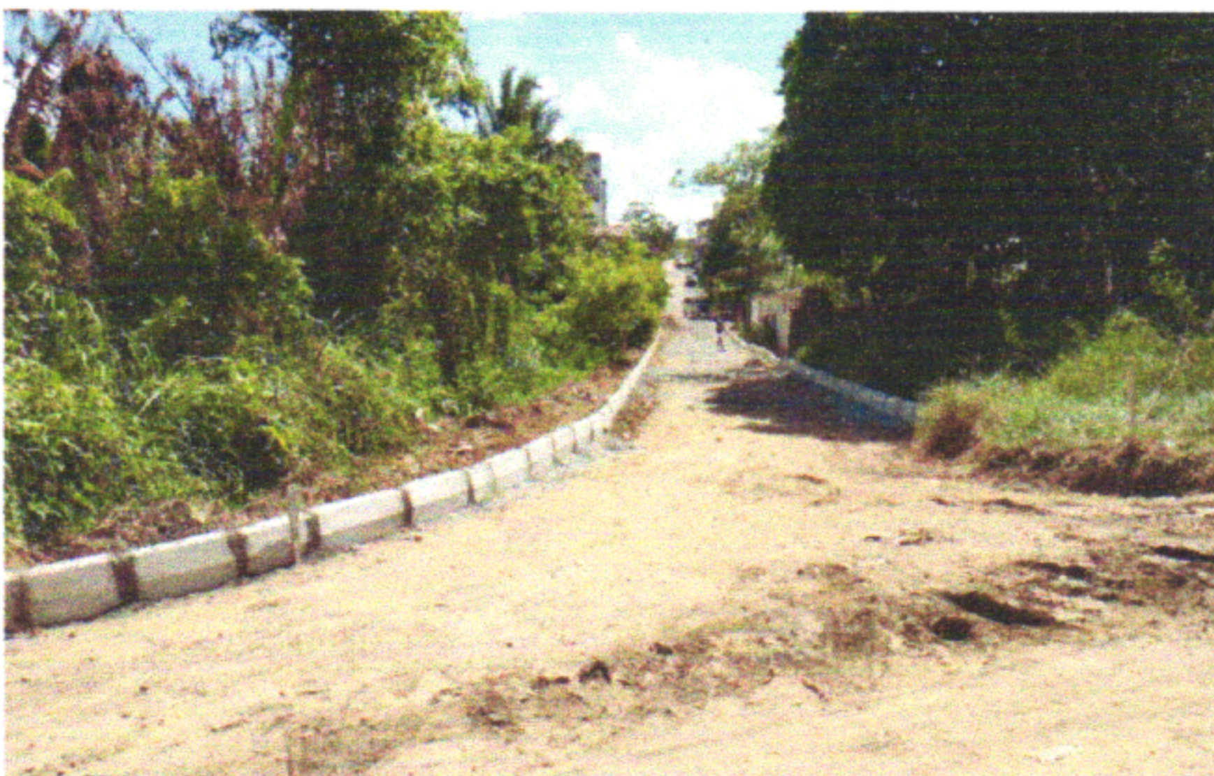
RUA JOÃO BEZERRA