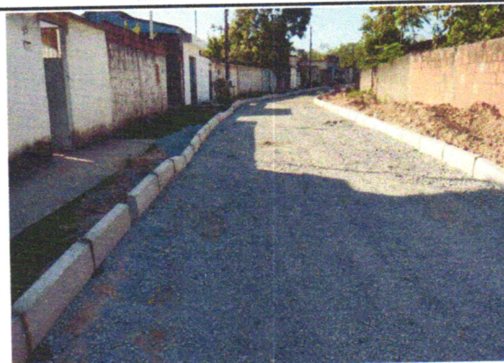
RUA PNFILE MONTEIRO DE QUEIROZ