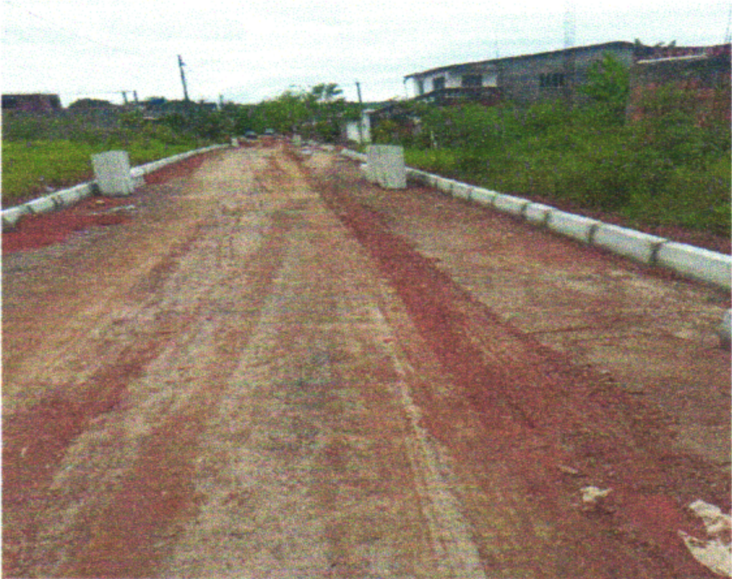
RUA DJANIRA DA FONTE

PROPONENTE: PREFEITURA DE SÃO LOURENÇO DA MATA/PE OBJETO: CONTRATAÇÃO DE EMPRESA ENGENHARIA PARA PAVIMENTAÇÃO E DRENAGEM DE DIVERSAS RUAS DO BAIRRO DE MURIBARA, NO MUNICÍPIO DE SÃO LOURENÇO DA MATA EMPREENDIMENTO: CONSTRUÇÃO DE RODOVIAS E FERROVIAS