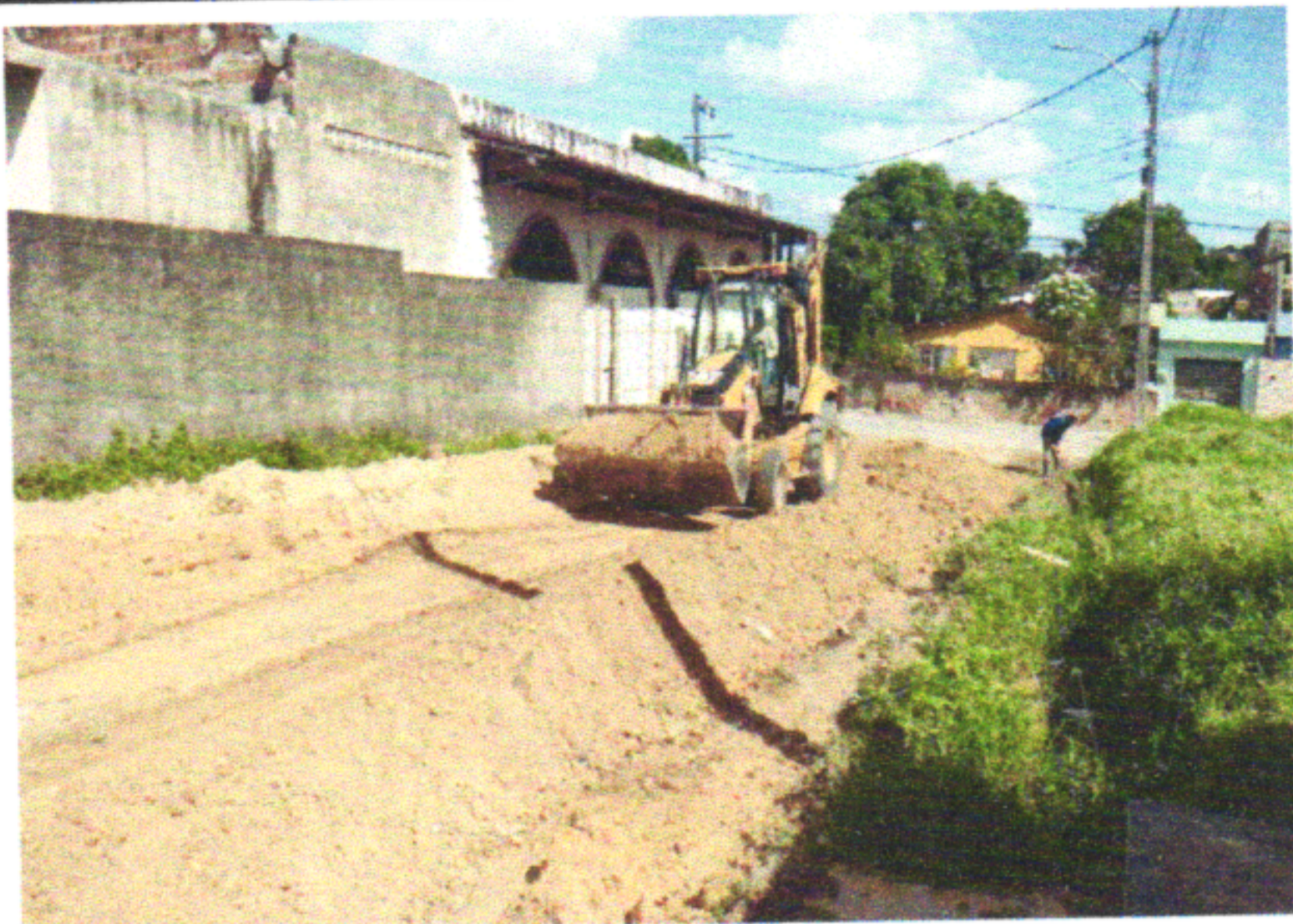
RUA PNFILE MONTEIRO DE QUEIROZ

EMPREENDIMENTO: CONSTRUÇÃO DE RODOVIAS E FERROVIAS