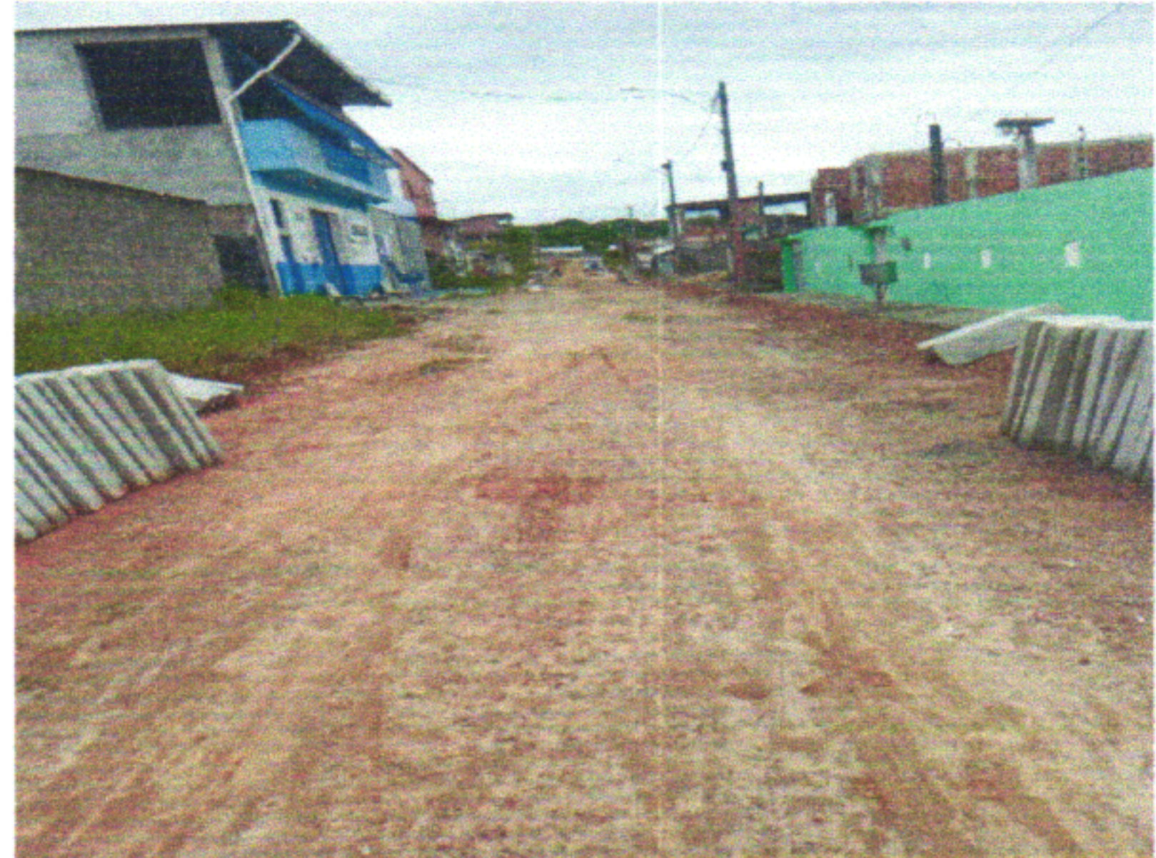
RUA EURICO DA FONTE