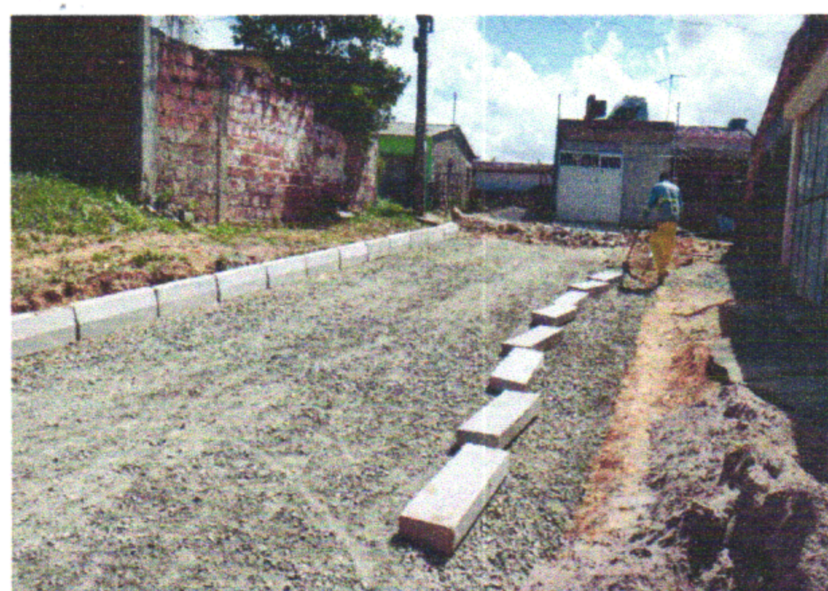
RUA MANOEL REIS