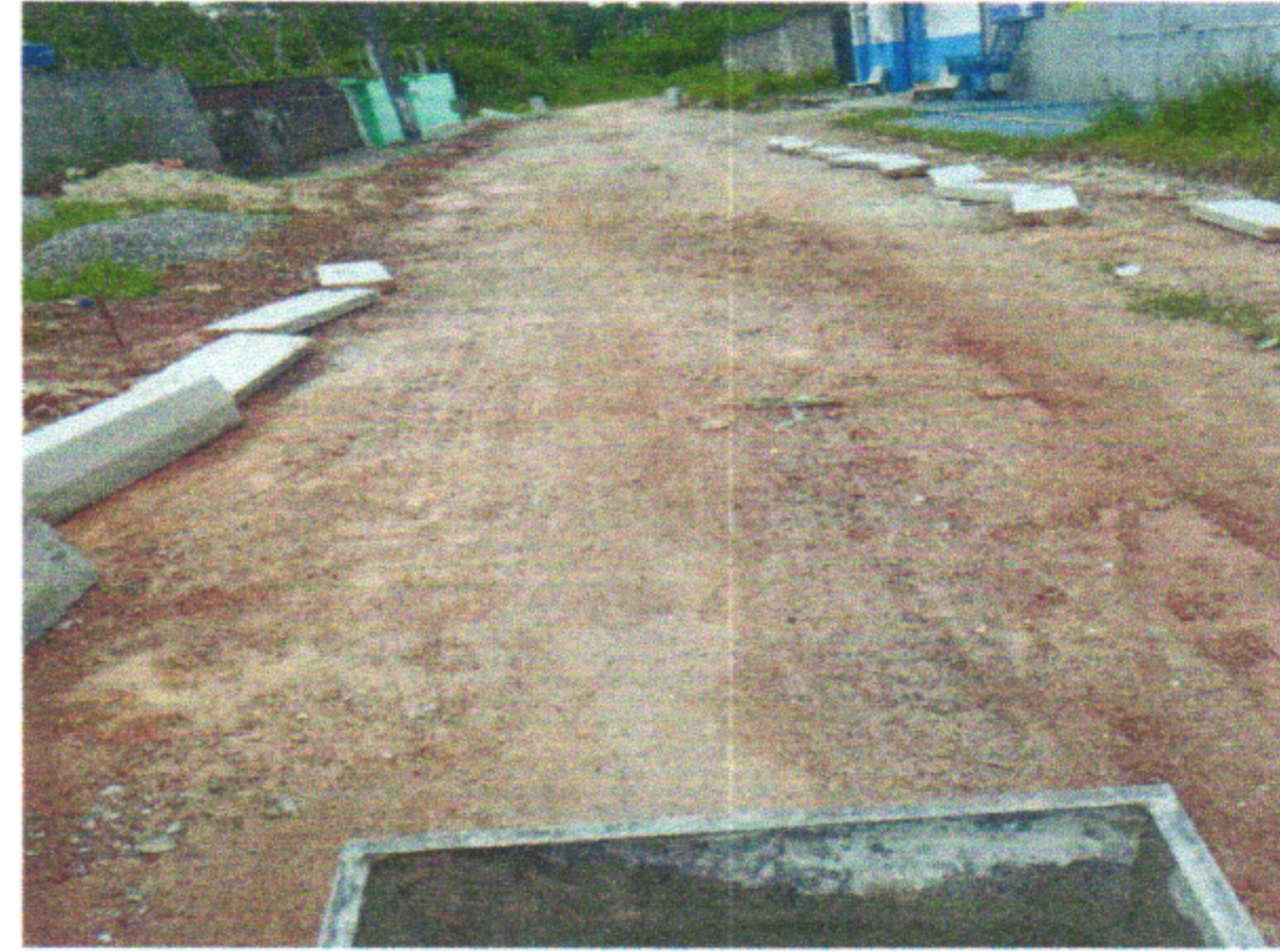
RUA EURICO DA FONTE