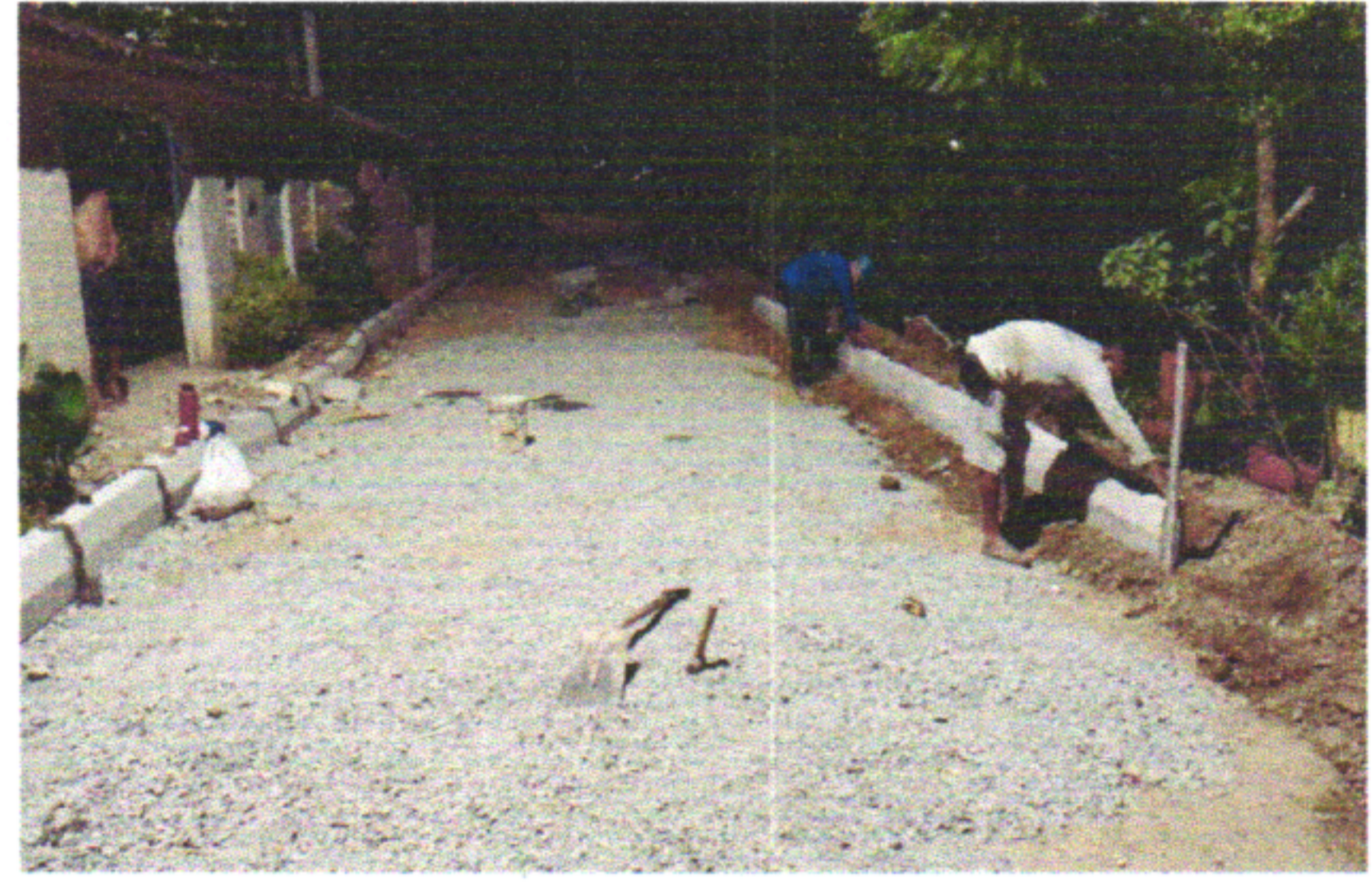
RUA JOÃO BEZERRA