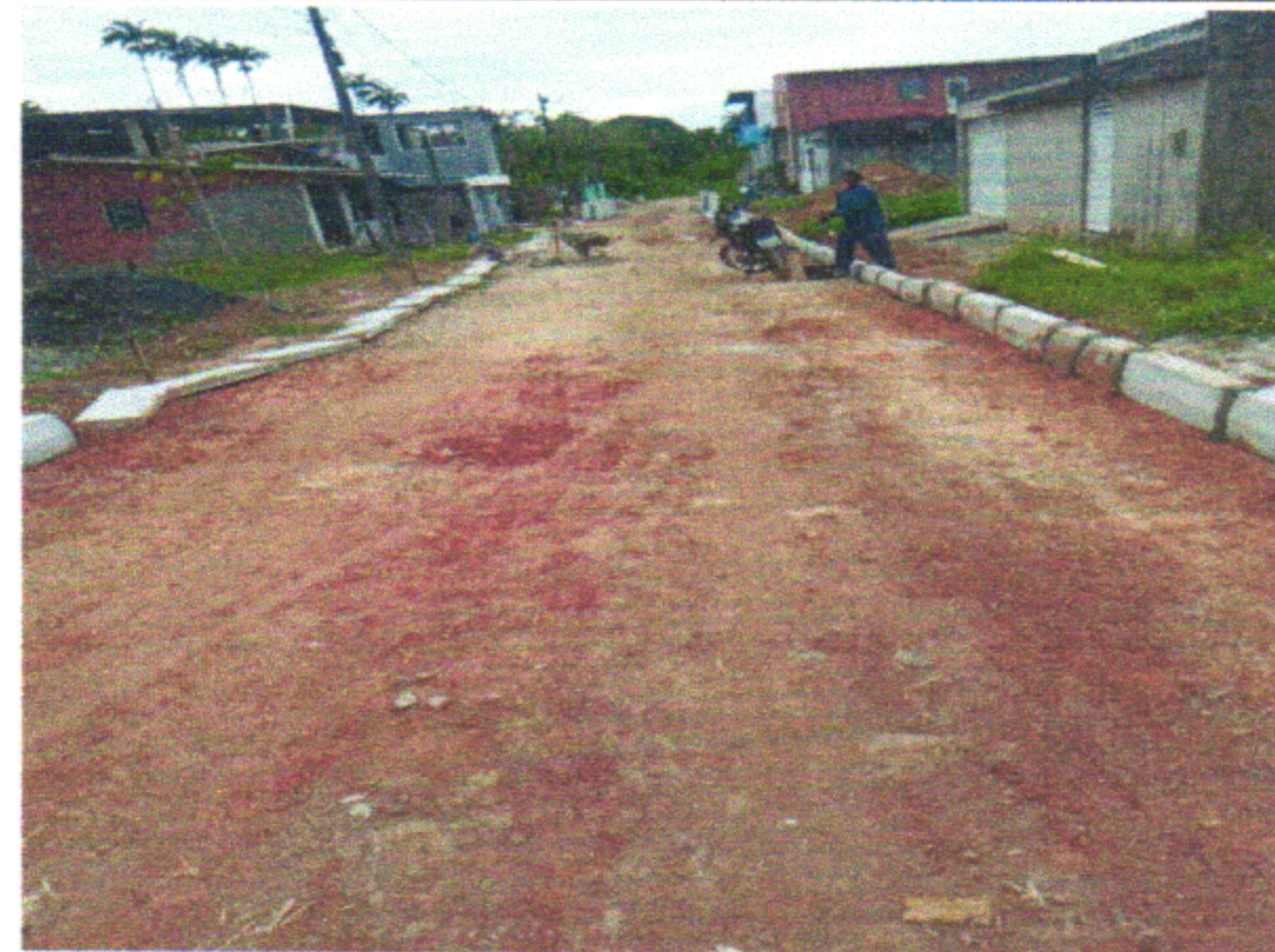
RUA EURICO DA FONTE