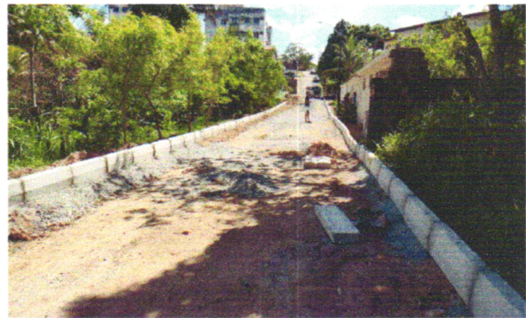
RUA JOÃO BEZERRA