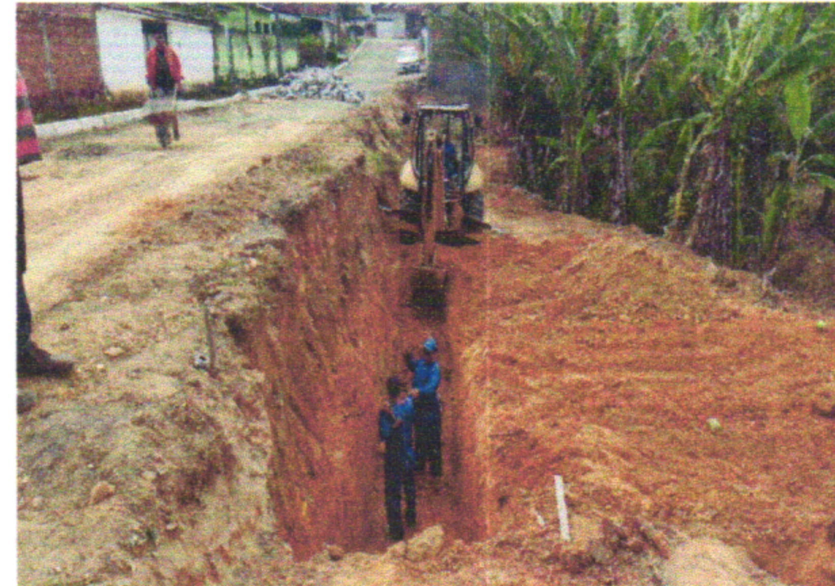
RUA MANOEL REIS