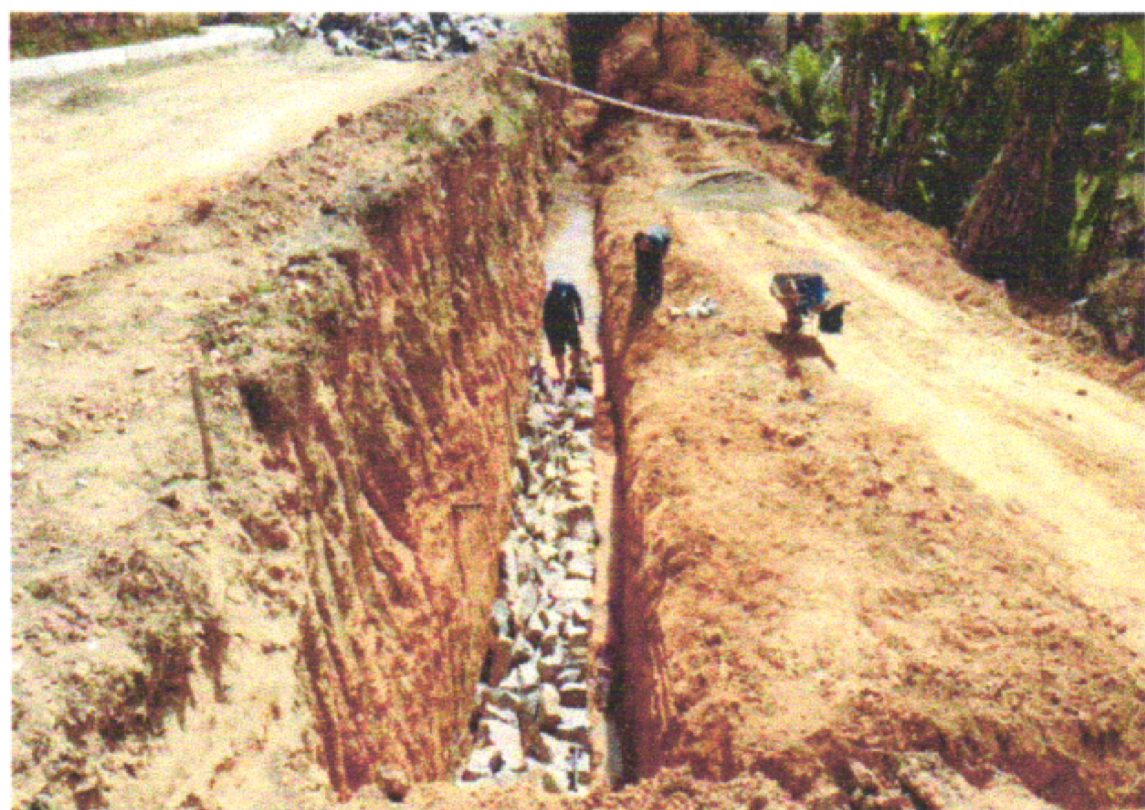
RUA MANOEL REIS