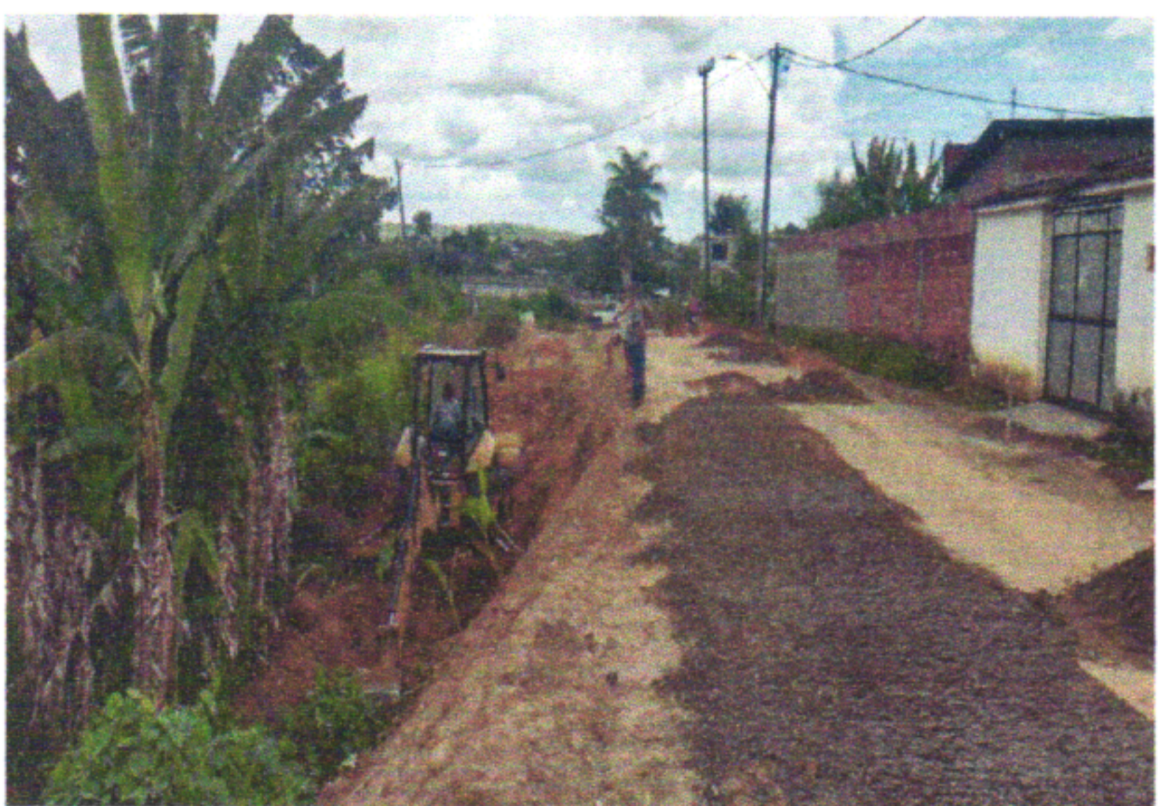
RUA MANOEL REIS