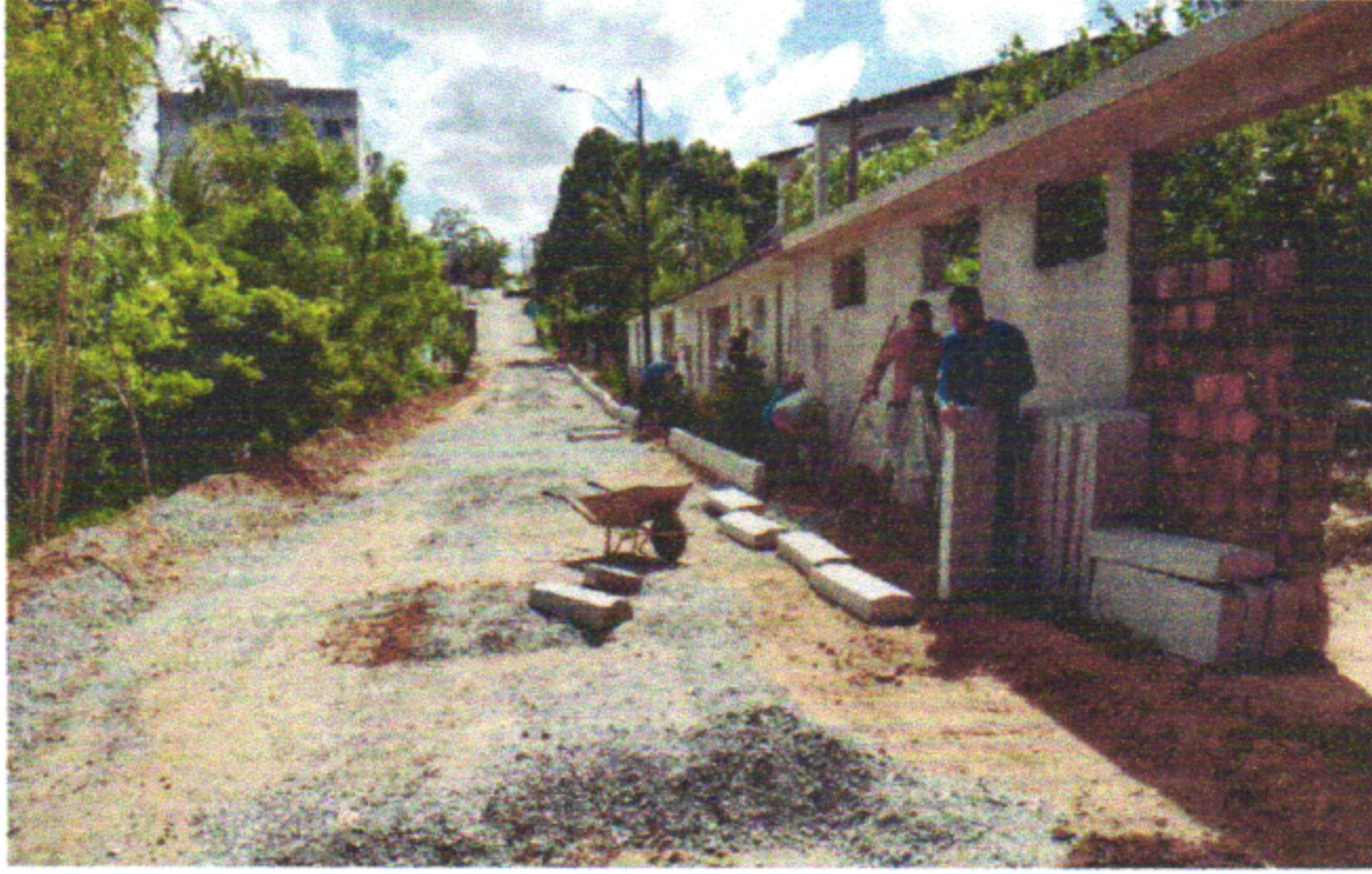
RUA JOÃO BEZERRA

EMPREENDIMENTO: CONSTRUÇÃO DE RODOVIAS E FERROVIAS