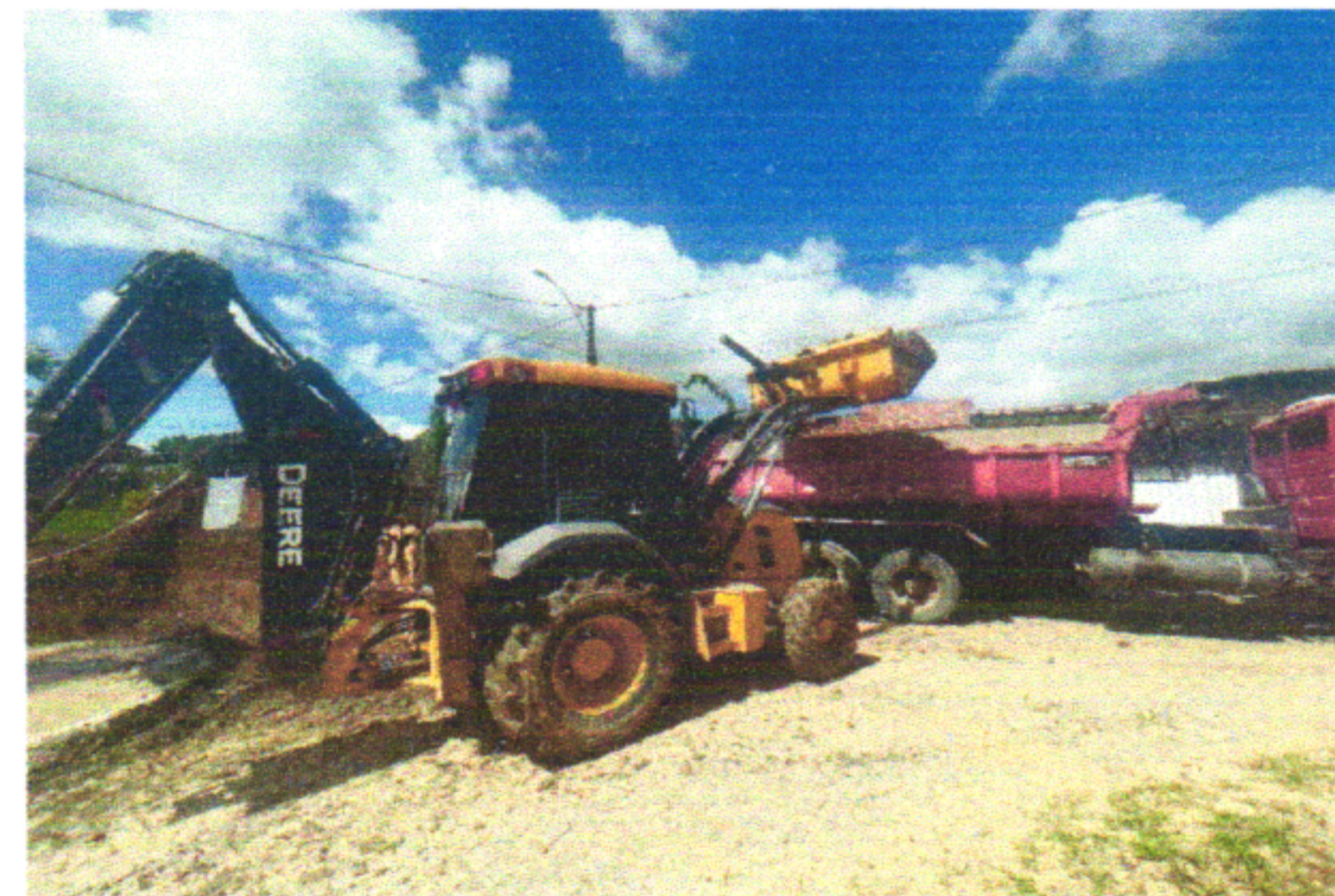
RUA EUGÊNIO CARDOSO DA FONTE