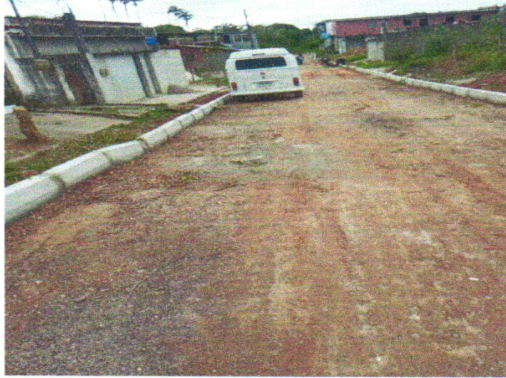
RUA EURICO DA FONTE