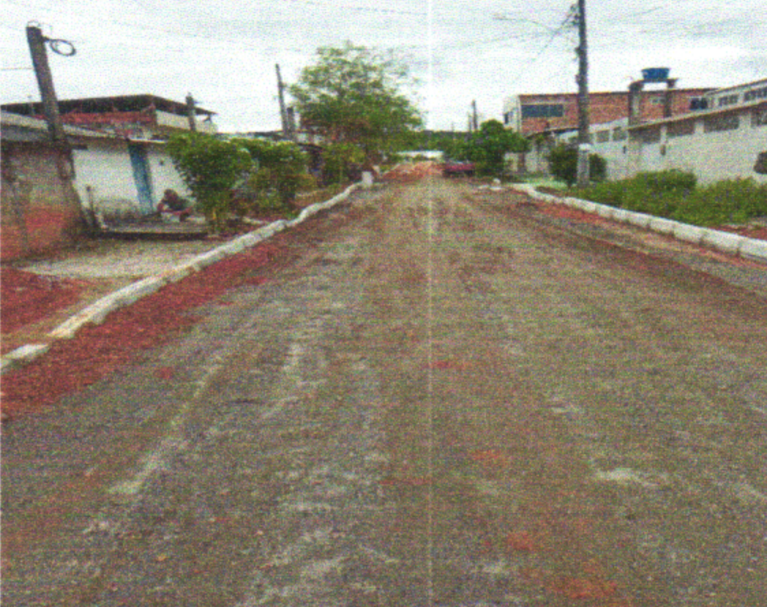
RUA DJANIRA DA FONTE