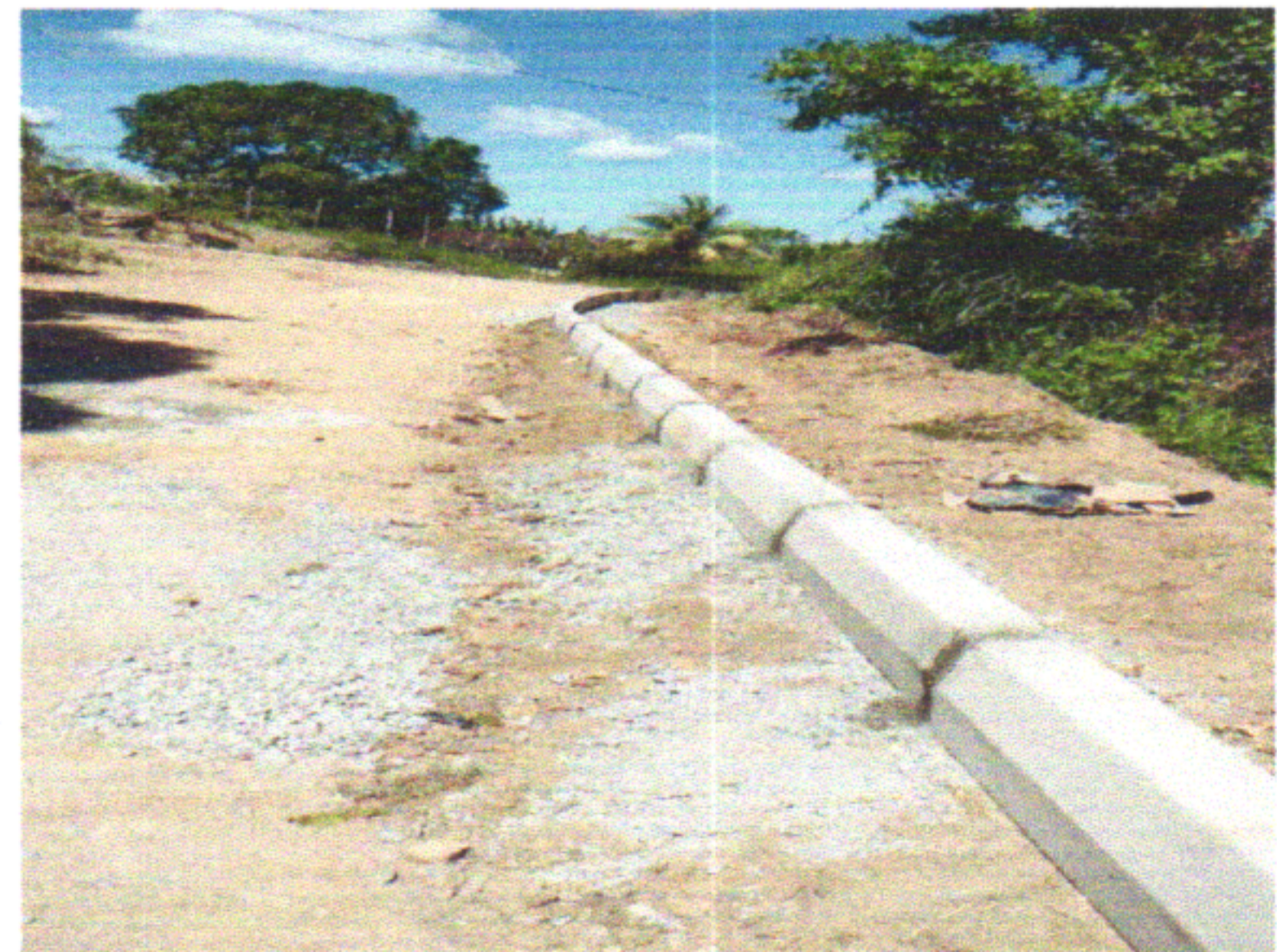
RUA JOÃO BEZERRA