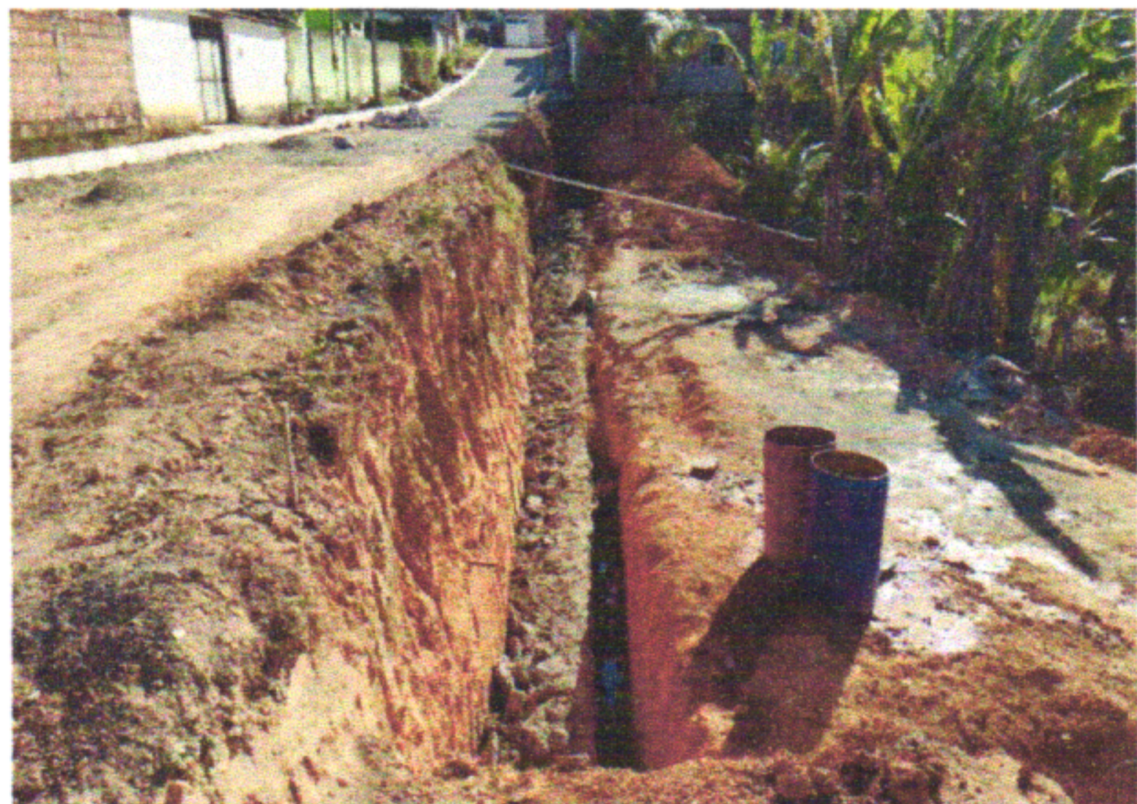
RUA MANOEL REIS

EMPREENDIMENTO: CONSTRUÇÃO DE RODOVIAS E FERROVIAS