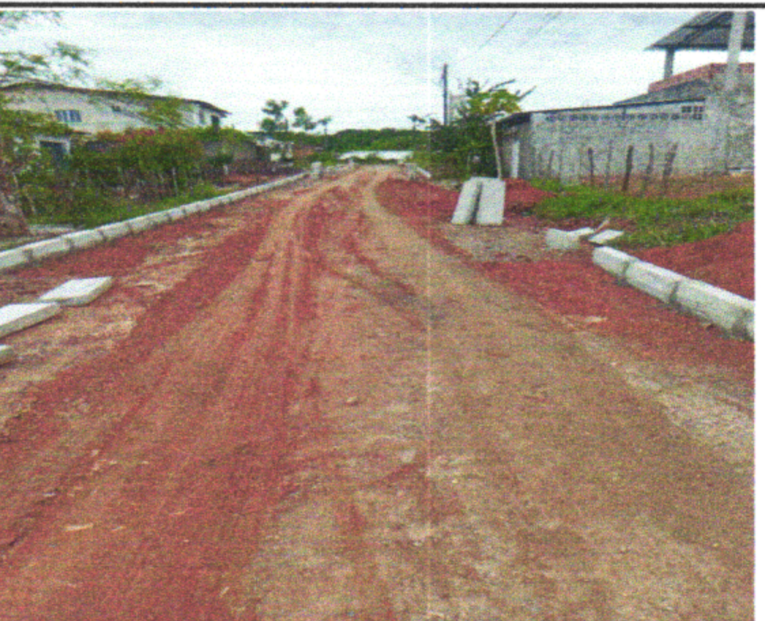
RUA DJANIRA DA FONTE