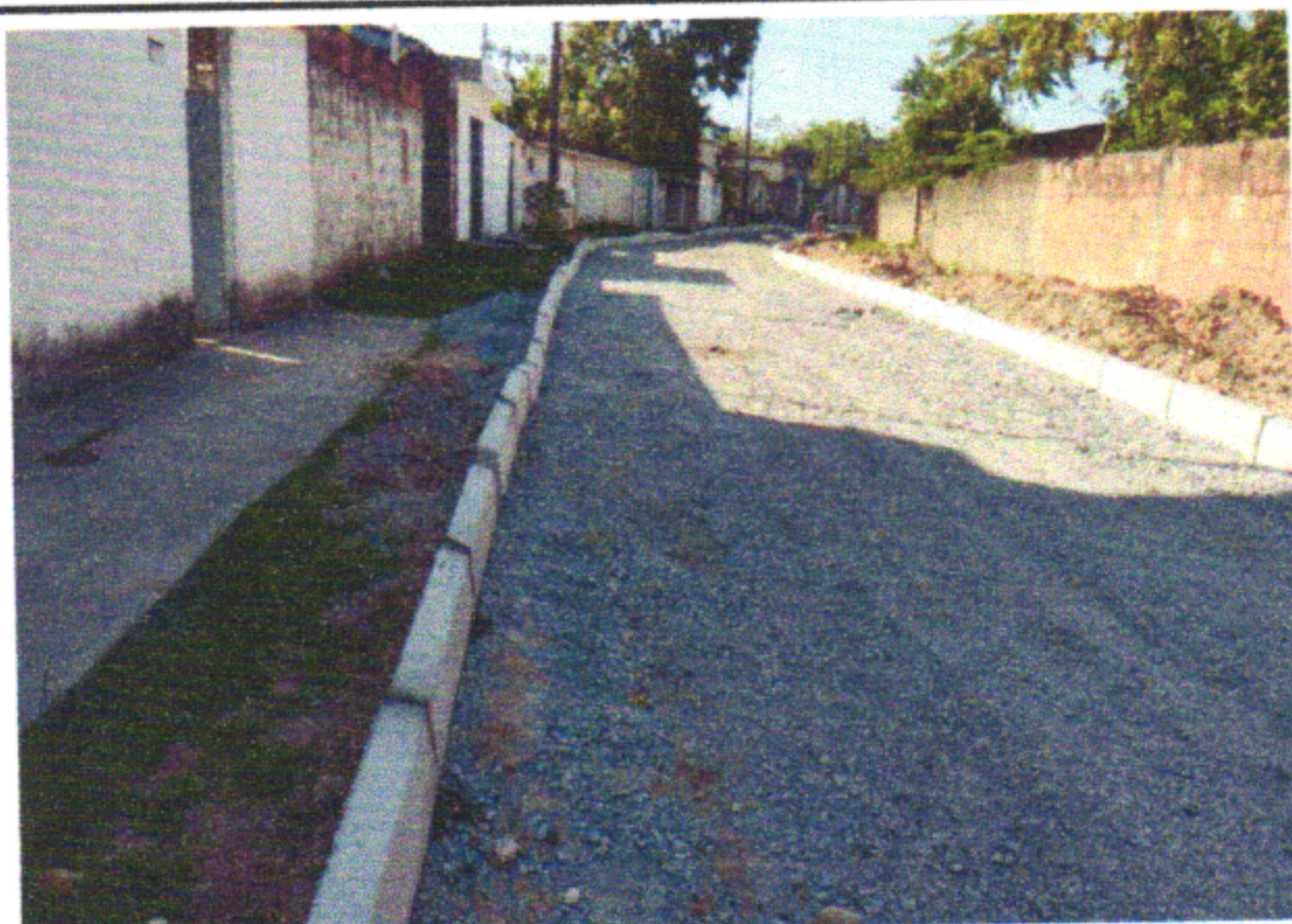
RUA PNFILE MONTEIRO DE QUEIROZ