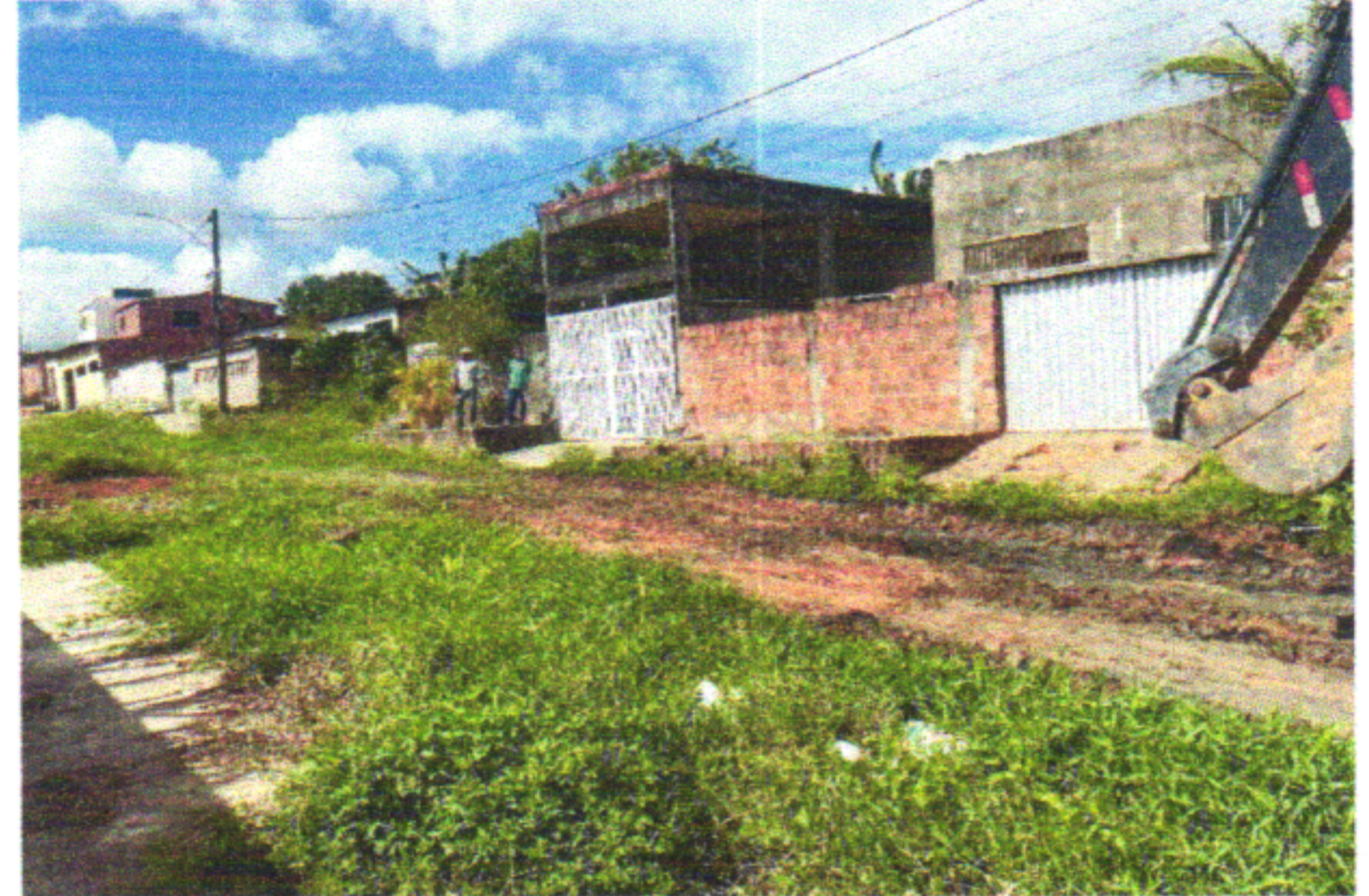
RUA EUGÊNIO CARDOSO DA FONTE