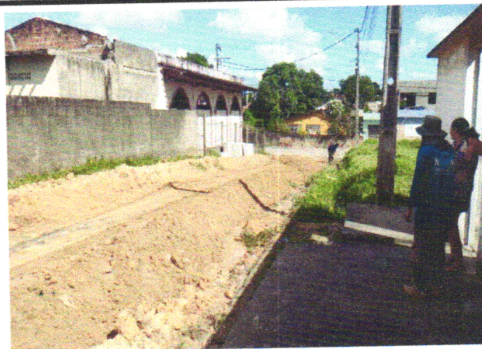
RUA PNFILE MONTEIRO DE QUEIROZ