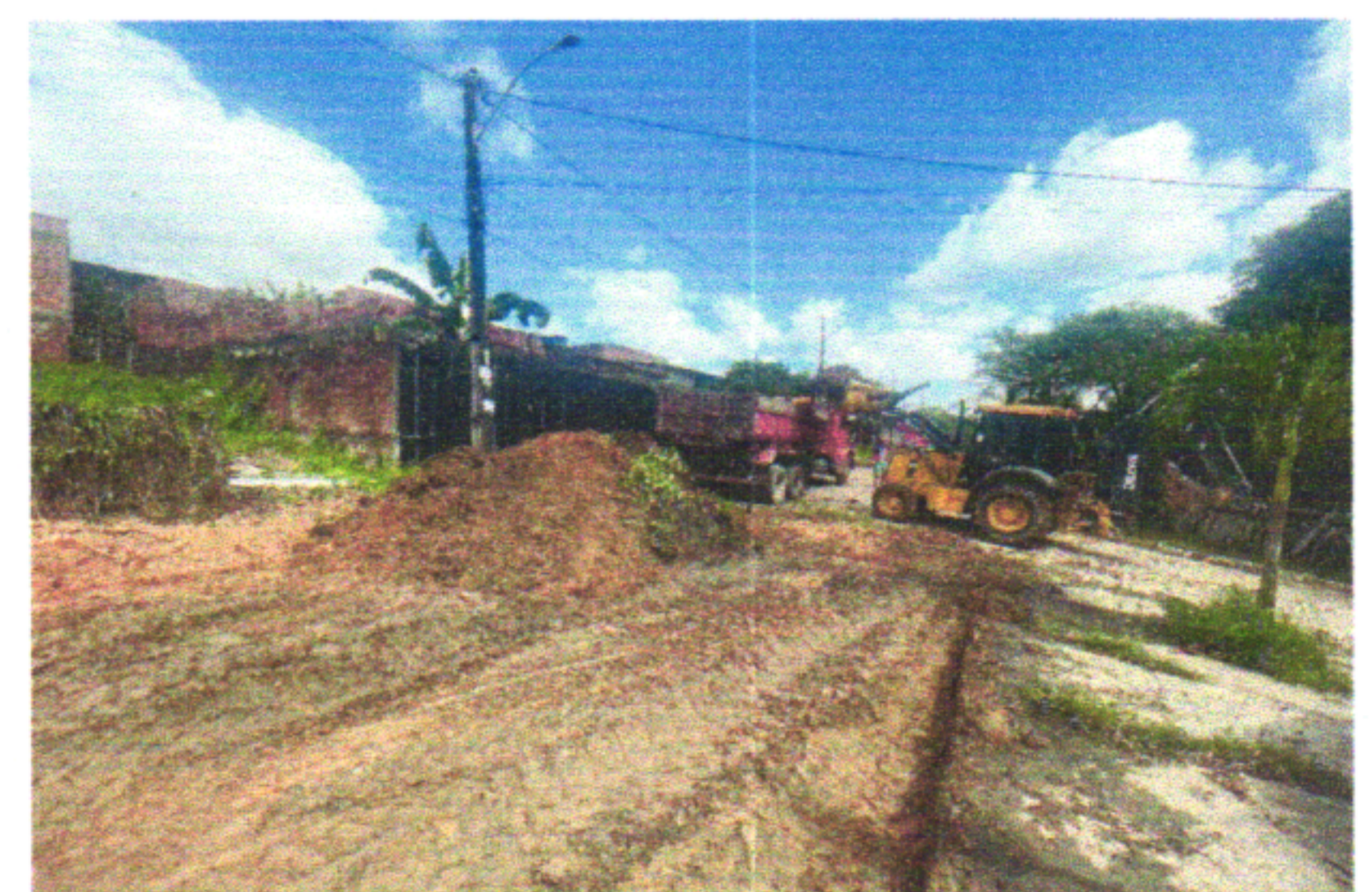
RUA EUGÊNIO CARDOSO DA FONTE