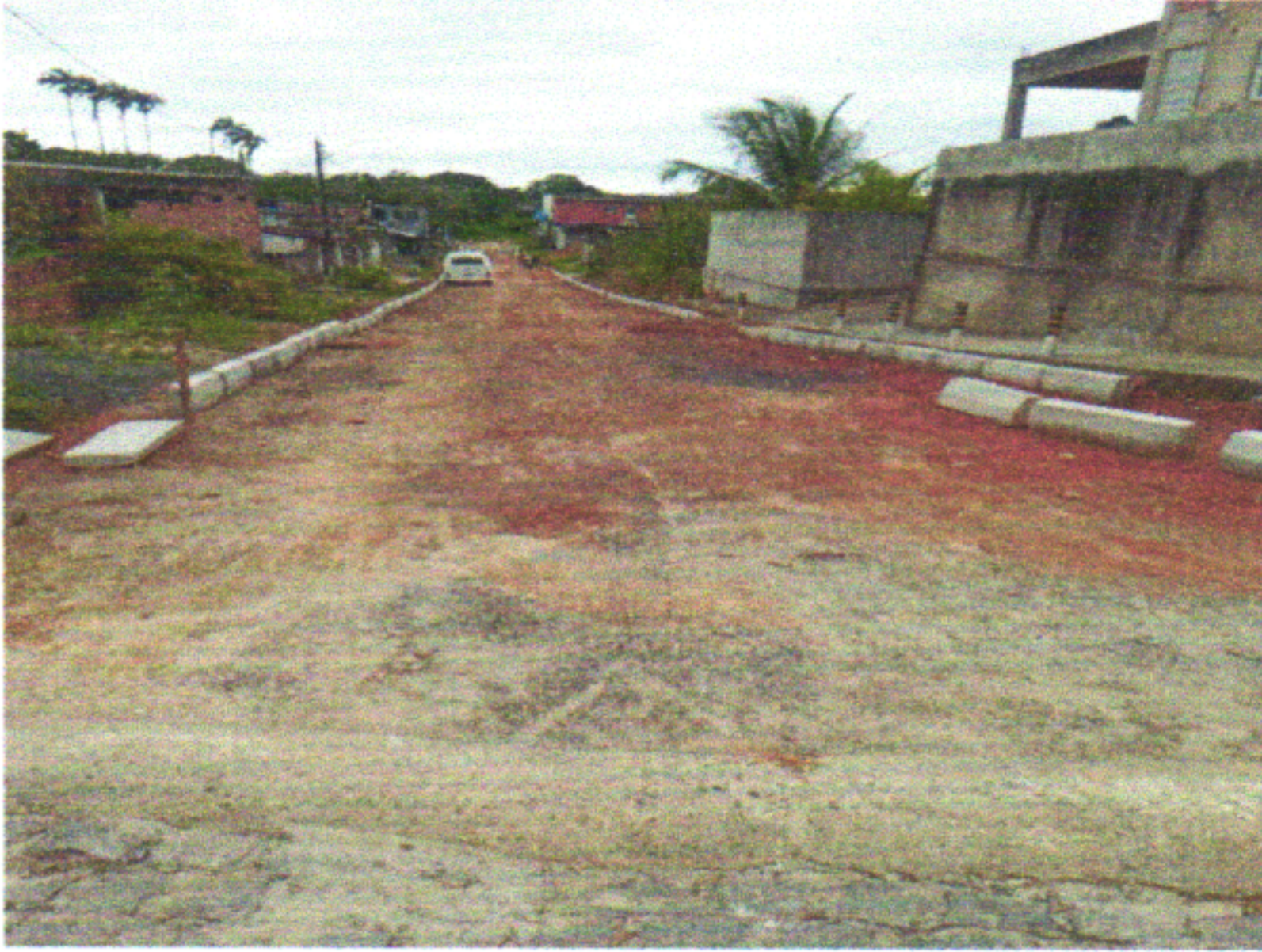
RUA EURICO DA FONTE

EMPREENDIMENTO: CONSTRUÇÃO DE RODOVIAS E FERROVIAS