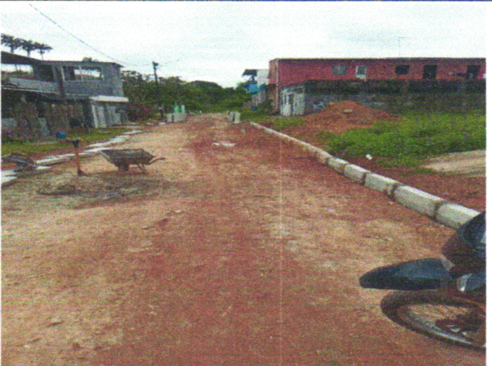
RUA EURICO DA FONTE