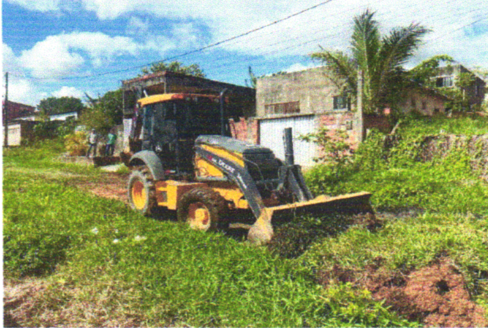
RUA EUGÊNIO CARDOSO DA FONTE

EMPREENDIMENTO: CONSTRUÇÃO DE RODOVIAS E FERROVIAS