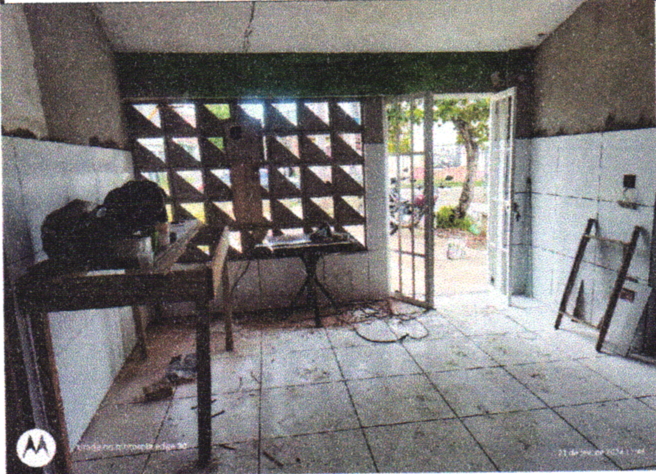
1.5.3 REVESTIMENTO CERÂMICO PARA PISO