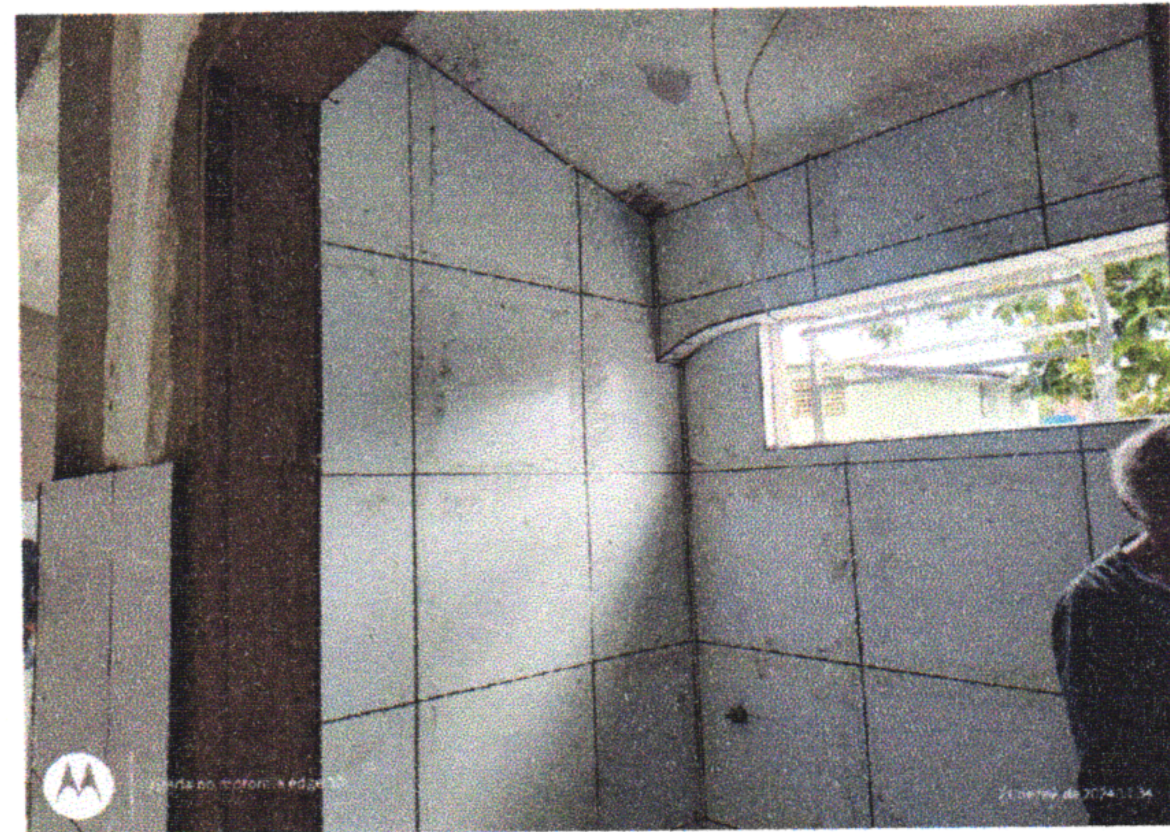
1.5.11 REVESTIMENTO CERÂMICO PAREDE