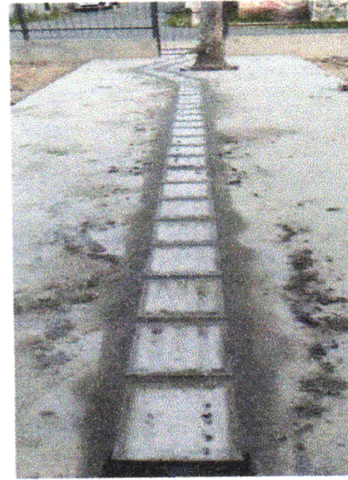
1.5.6 PISO PODOTÁTIL