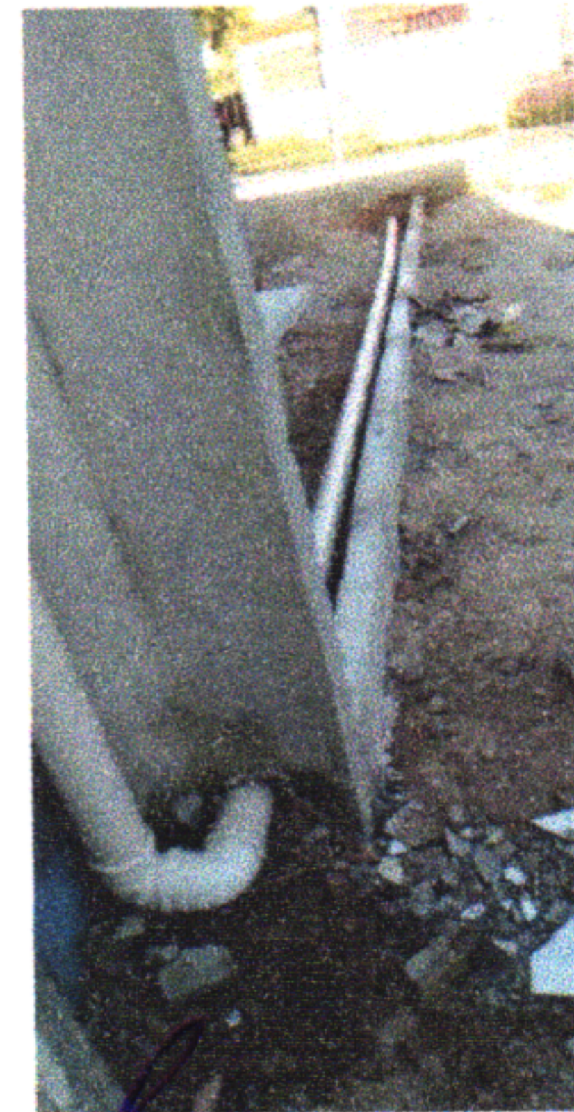
1.6.5 TUBOS DE PVC PARA AGUA PLUVIAL