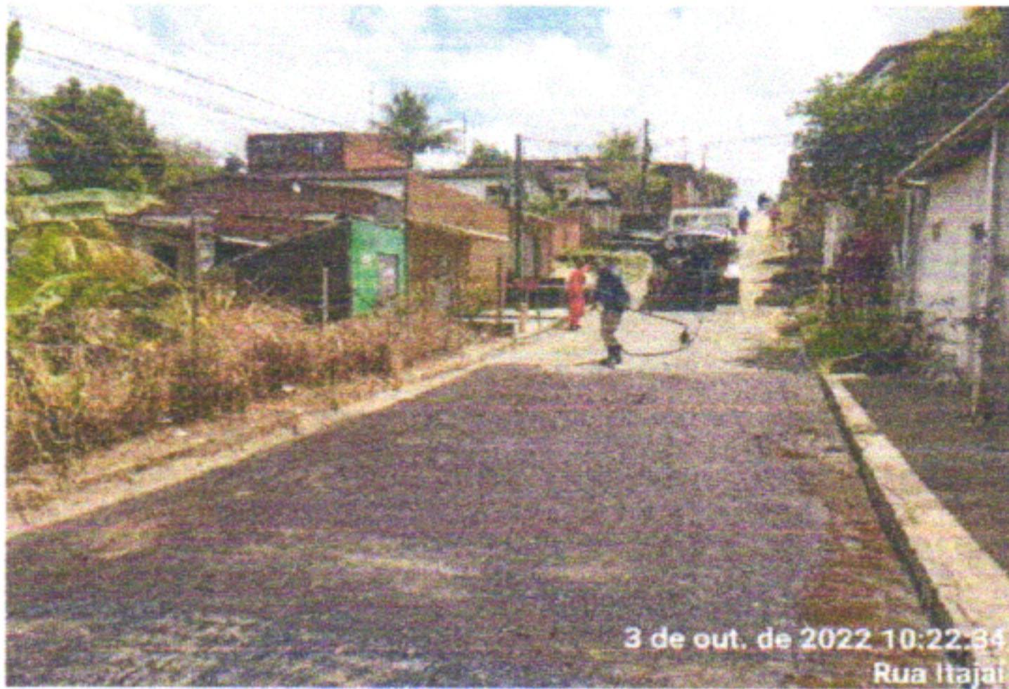
3 de out. de 2022 10:22:34 Rua Itajai