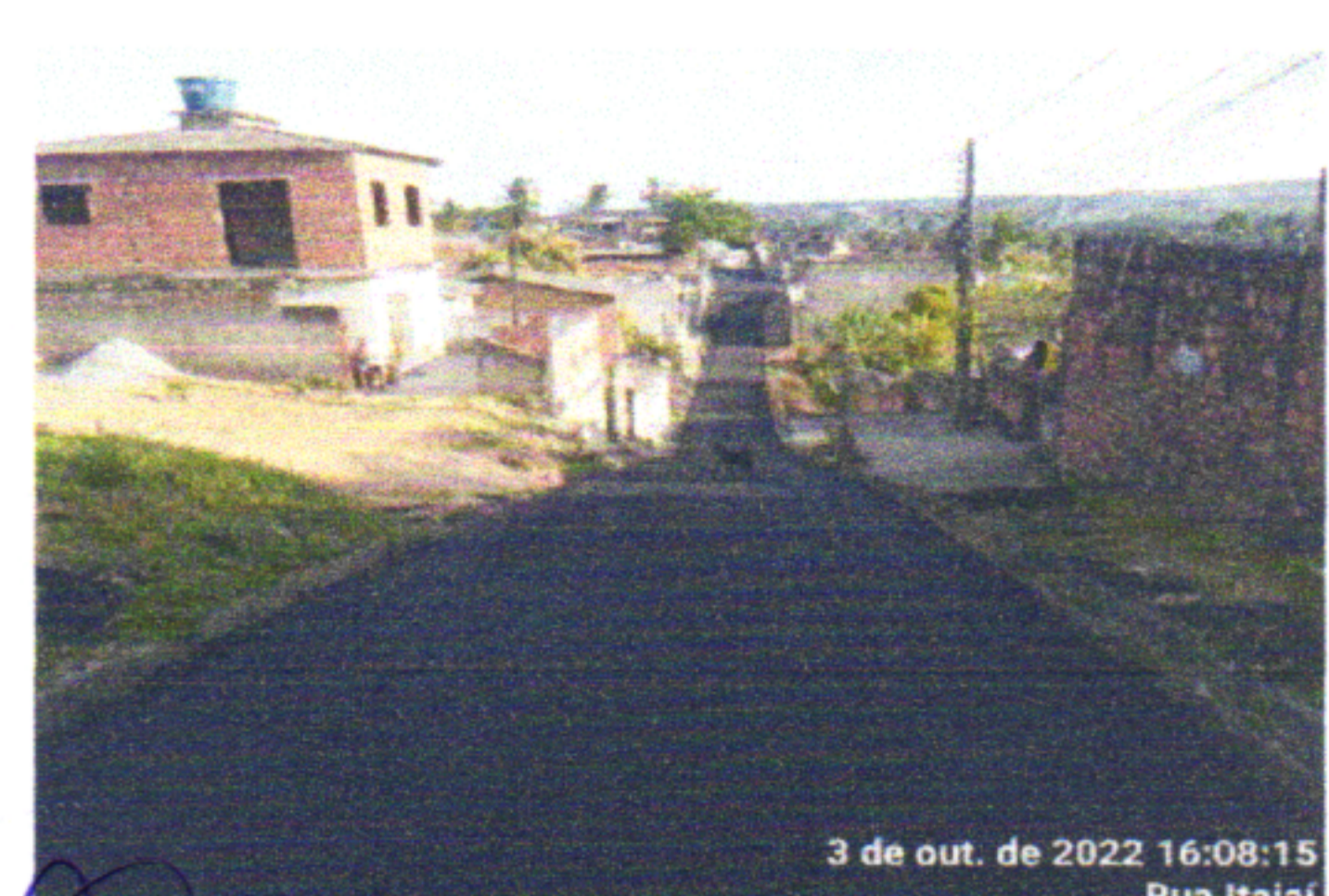
3 de out. de 2022 16:08:15 Rua Itajai

Arthur Felipe Melo de Almeida Engenheiro Civil CREAPE 1819351564