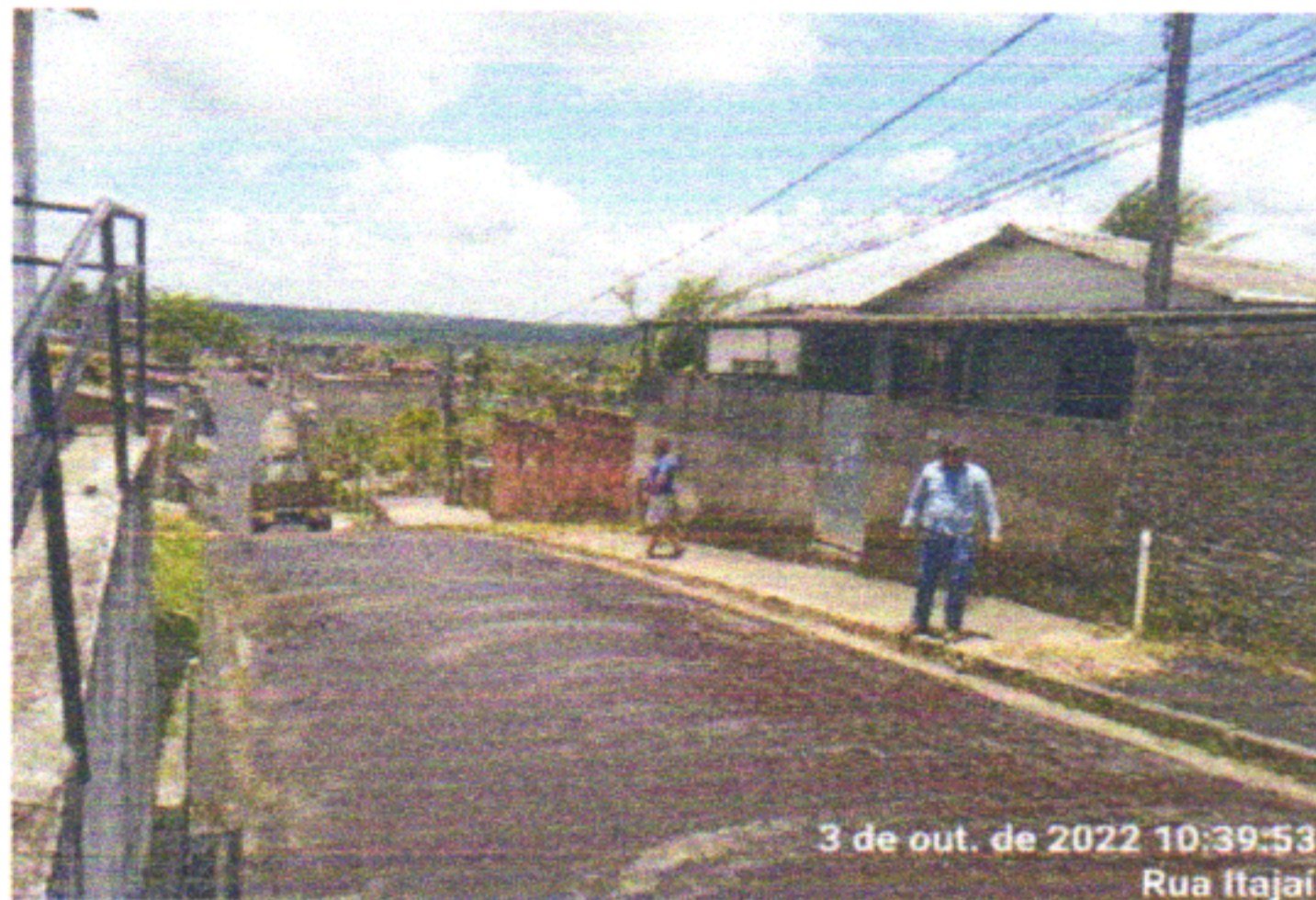
3 de out. de 2022 10:39:53 Rua Itajai