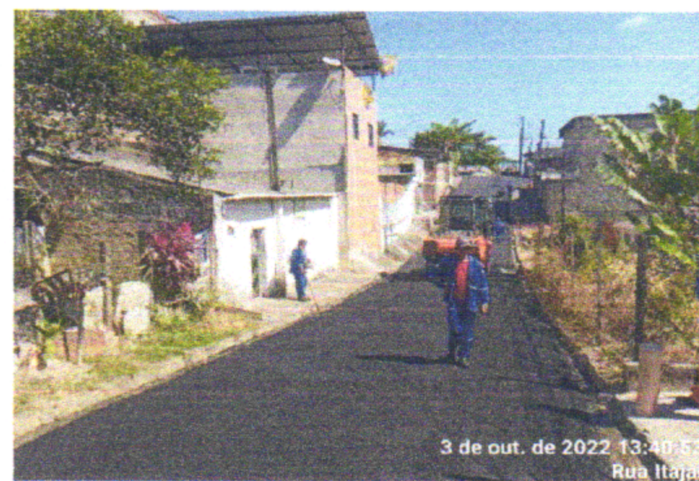
3 de out. de 2022 13:40:53 Rua Itajai