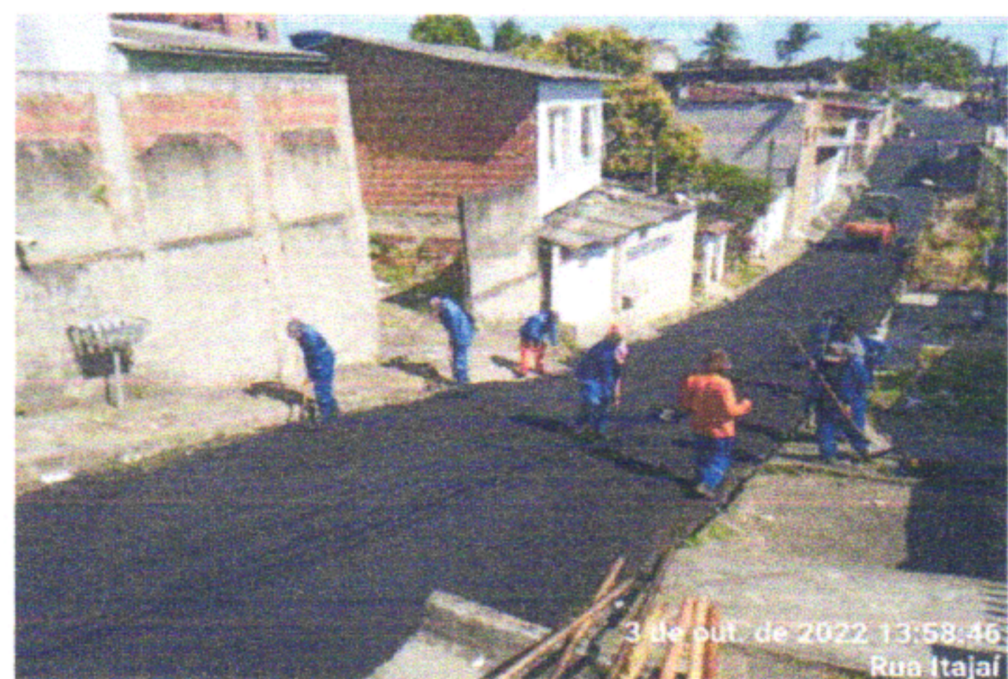
3 de out. de 2022 13:58:46 Rua Itajai