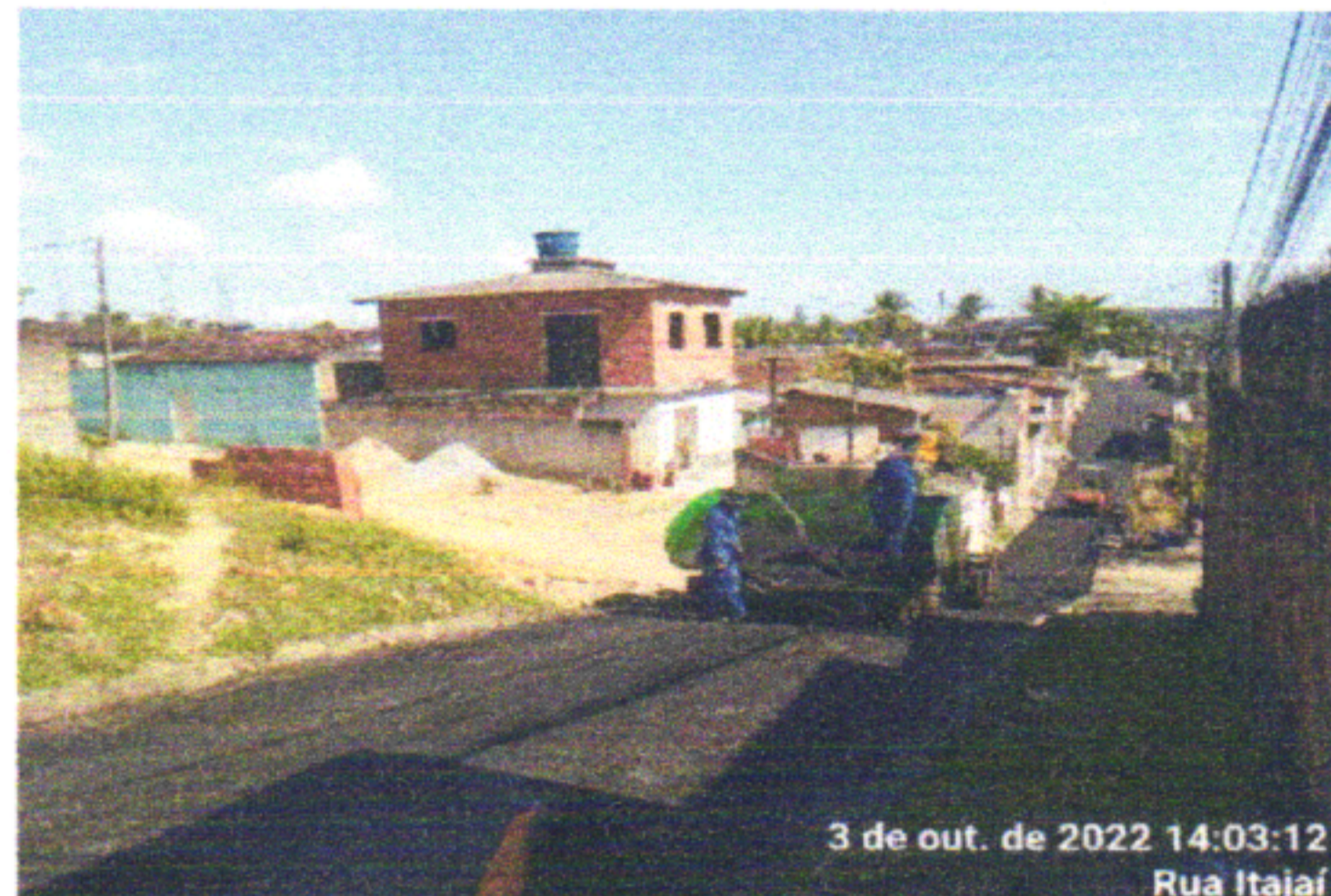
3 de out. de 2022 14:03:12 Rua Itajai