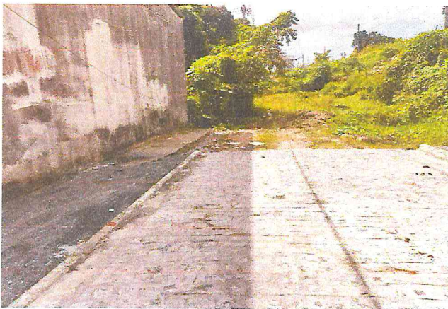
RUA ALAMEDA DAS PALMEIRAS (E0 à E10+4,70) - TIÚMA - E10 + 4,70