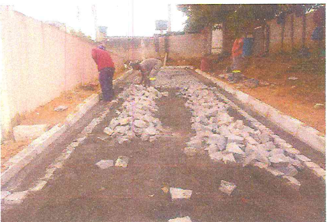
EXECUÇÃO DE PAVIMENTO - RUA NOSSA SENHORA DE FÁTIMA ( E00 À E02) - DISTRITO DE MATRIZ DA LUZ