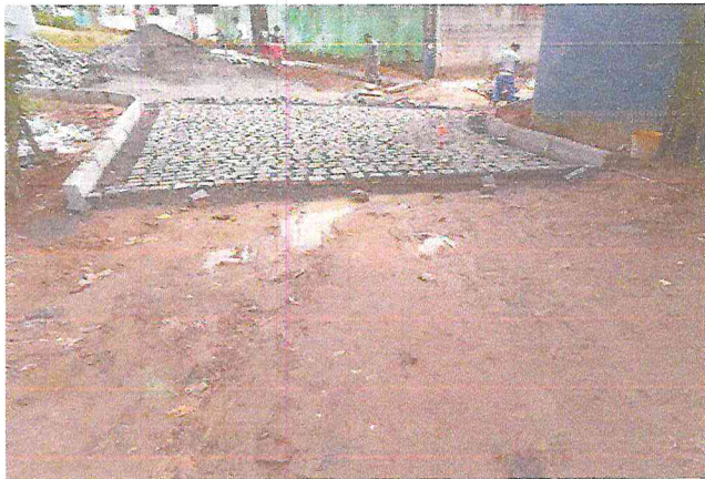
TRAVESSA SANTA TEREZA (E4 à E7+9,12) - DISTRITO DE MATRIZ DA LUZ