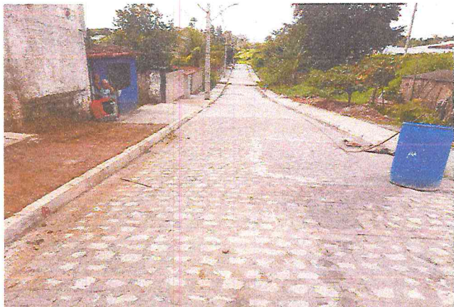
RUA ALAMEDA DAS PALMEIRAS (E0 à E10+4,70) - TIÚMA - E2