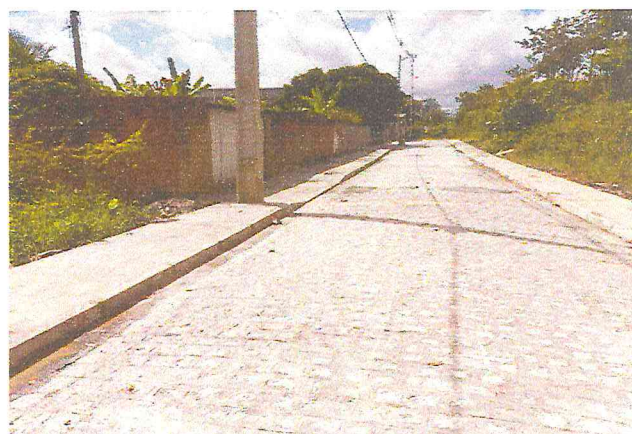
RUA ALAMEDA DAS PALMEIRAS (E0 à E10+4,70) - TIÚMA - E5