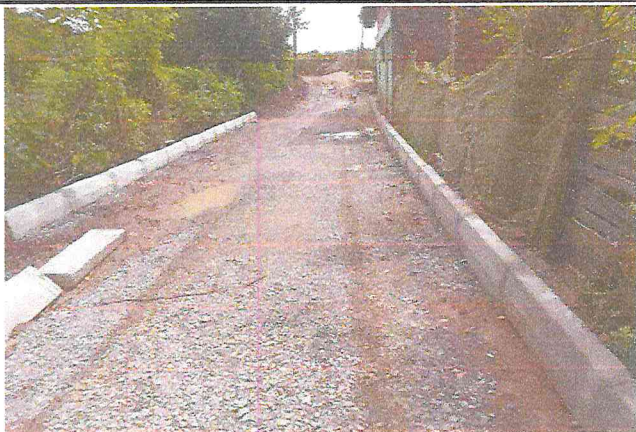
TRAVESSA SANTA TEREZA (E4 à E7+9,12) - DISTRITO DE MATRIZ DA LUZ