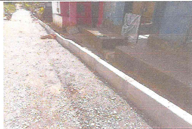
TRAVESSA SANTA TEREZA (E4 à E7+9,12) - DISTRITO DE MATRIZ DA LUZ