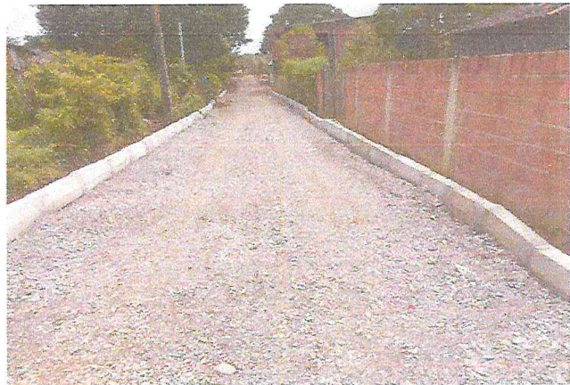
TRAVESSA SANTA TEREZA (E0 à E7+9,12) - DISTRITO DE MATRIZ DA LUZ