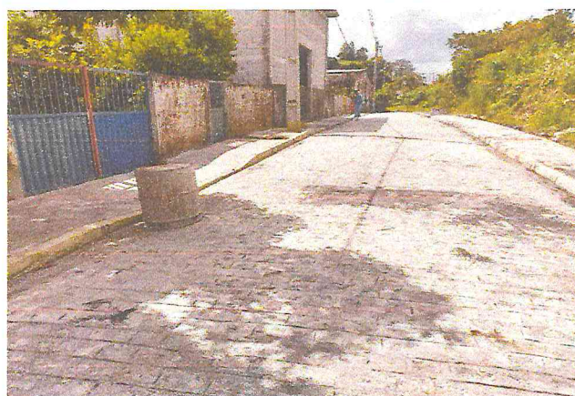
RUA ALAMEDA DAS PALMEIRAS (E0 à E10+4,70) - TIÚMA - E7