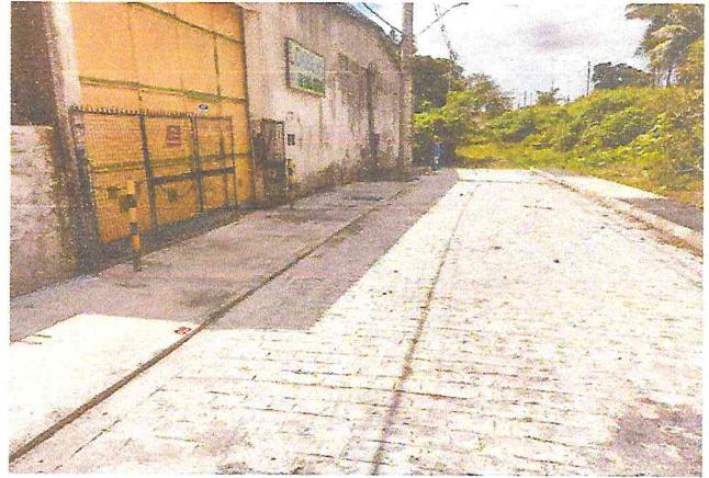
RUA ALAMEDA DAS PALMEIRAS (E0 à E10+4,70) - TIÚMA - E9