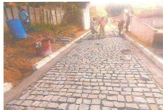
EXECUÇÃO DE PAVIMENTO - RUA NOSSA SENHORA DE FÁTIMA ( E00 À E02) - DISTRITO DE MATRIZ DA LUZ