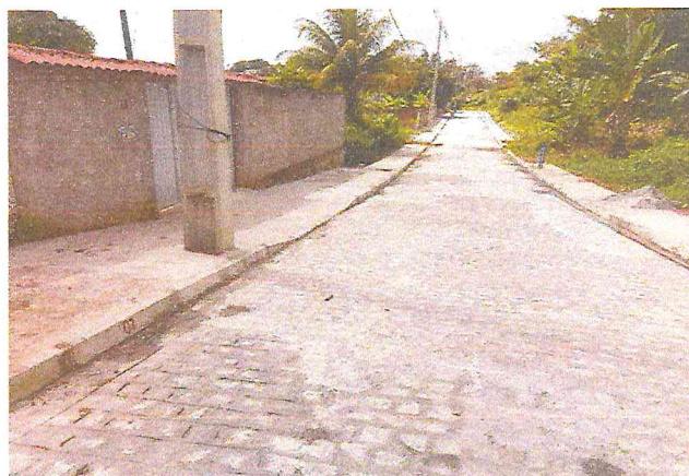
RUA ALAMEDA DAS PALMEIRAS (E0 à E10+4,70) - TIÚMA - E3