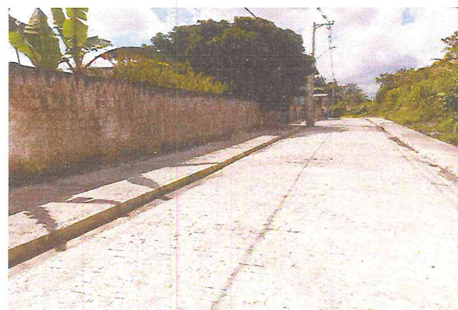
RUA ALAMEDA DAS PALMEIRAS (E0 à E10+4,70) - TIÚMA - E6