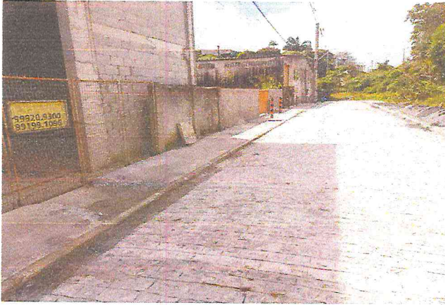
RUA ALAMEDA DAS PALMEIRAS (E0 à E10+4,70) - TIÚMA - E8