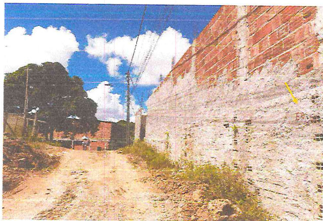
(E0) TRAVESSA SANTA TEREZA (E0 à E7+9,12) - DISTRITO DE MATRIZ DA LUZ