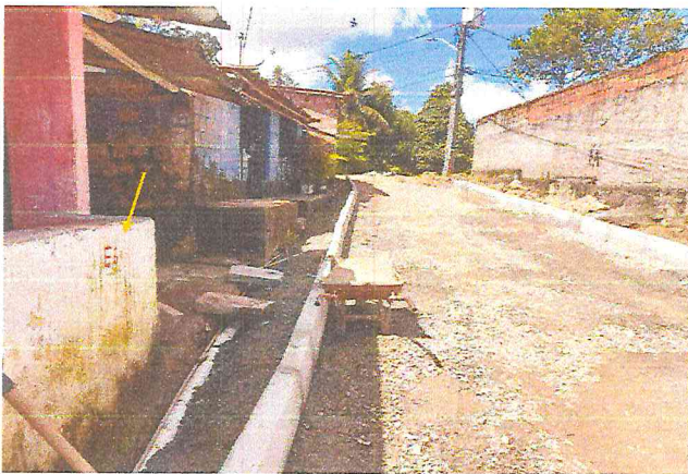
(E6) TRAVESSA SANTA TEREZA (E0 à E7+9,12) - DISTRITO DE MATRIZ DA LUZ