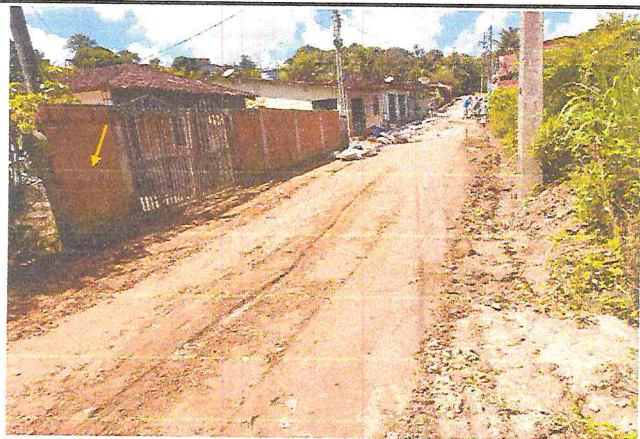
(E3) TRAVESSA SANTA TEREZA (E0 à E7+9,12) - DISTRITO DE MATRIZ DA LUZ