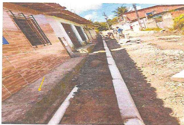
(E4) TRAVESSA SANTA TEREZA (E0 à E7+9,12) - DISTRITO DE MATRIZ DA LUZ