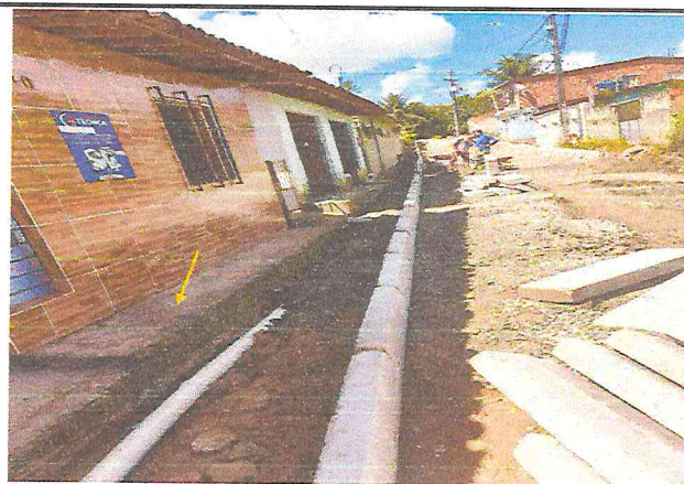
(E4) TRAVESSA SANTA TEREZA (E0 à E7+9,12) - DISTRITO DE MATRIZ DA LUZ