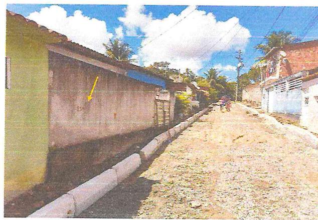
(E5) TRAVESSA SANTA TEREZA (E0 à E7+9,12) - DISTRITO DE MATRIZ DA LUZ