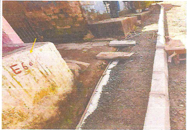
(E6) TRAVESSA SANTA TEREZA (E0 à E7+9,12) - DISTRITO DE MATRIZ DA LUZ