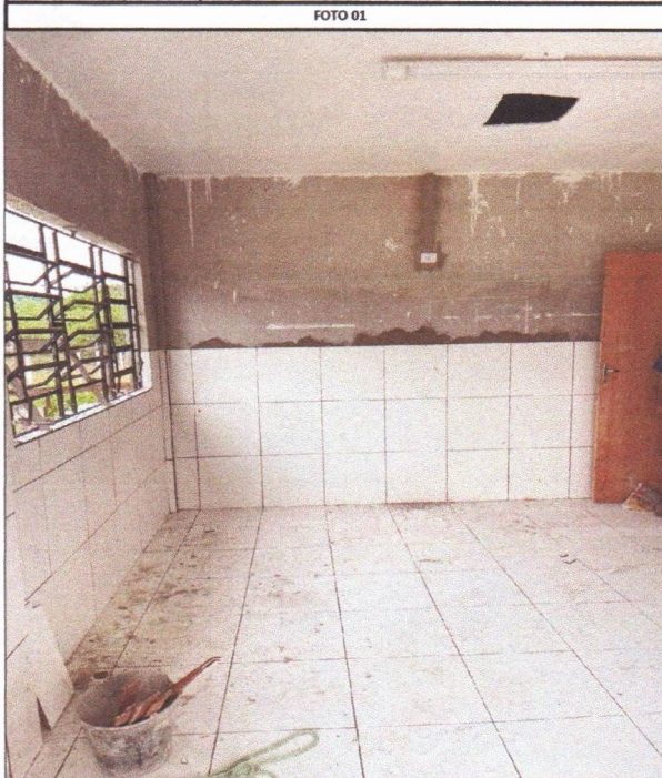
Assentamento de Cerâmica