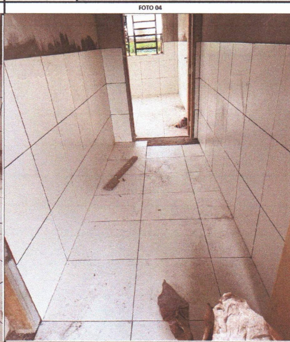
Assentamento de Cerâmica