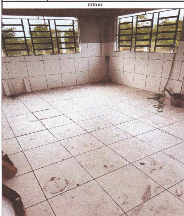
Assentamento de Cerâmica