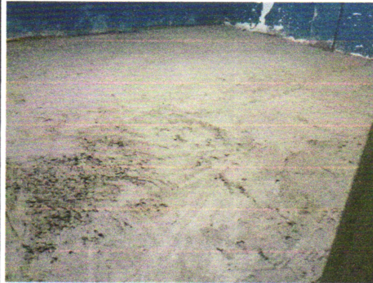
LASTRO DE CONCRETO MAGRO