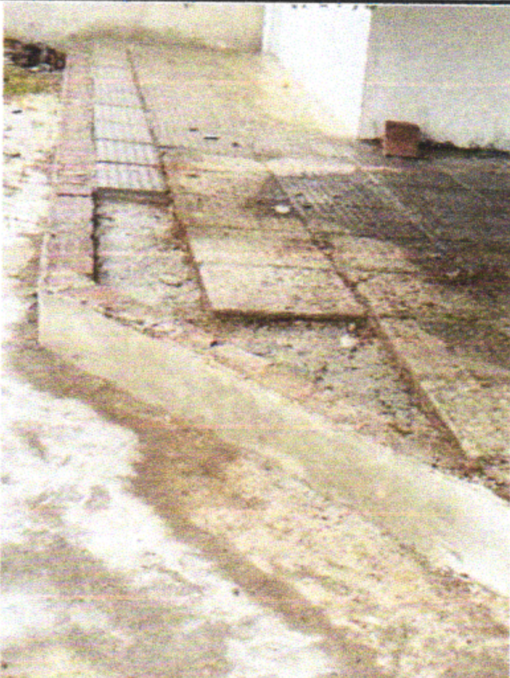
DEMOLIÇÃO DE CONCRETO