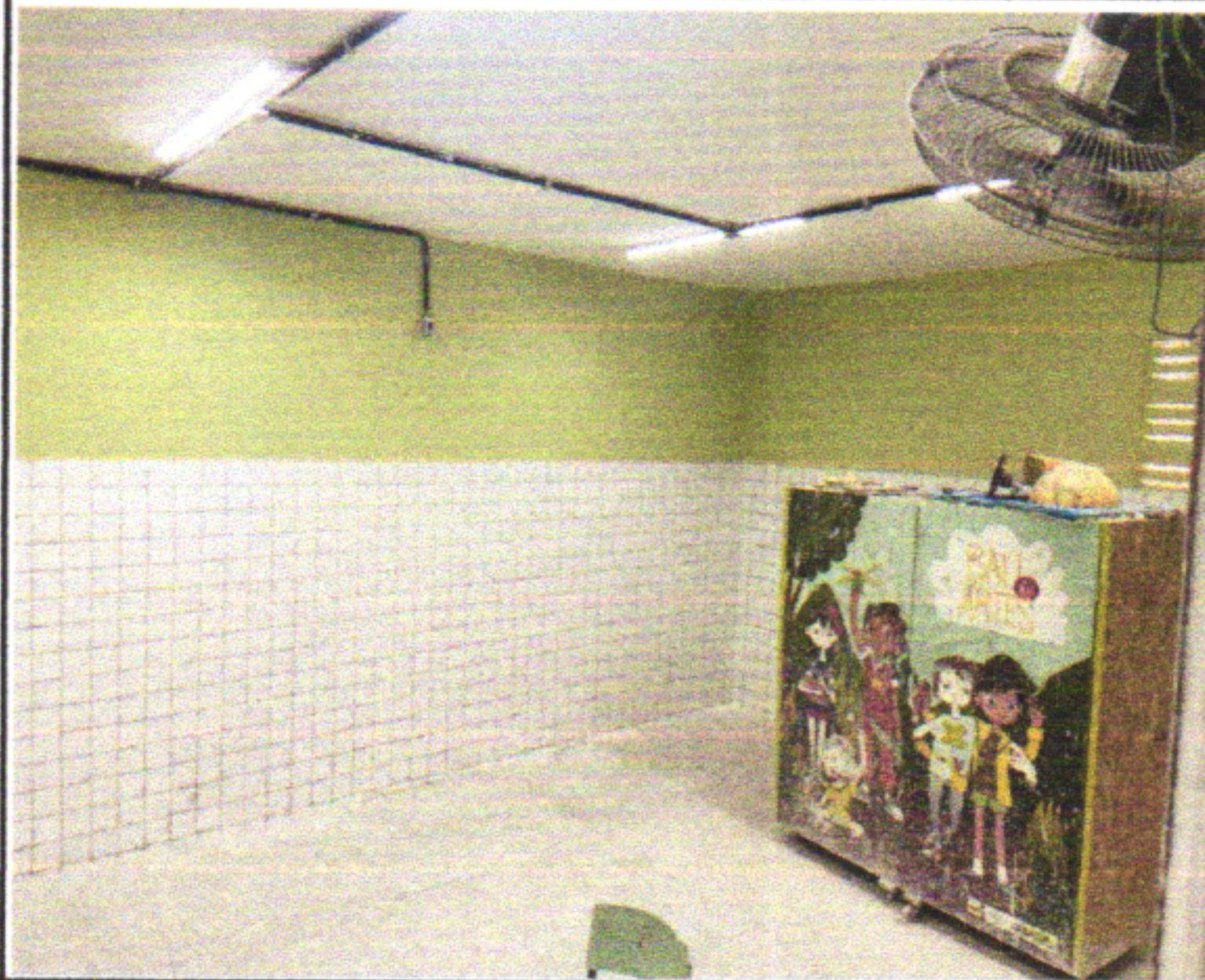
REVESTIMENTO CERÂMICO 10 X 10