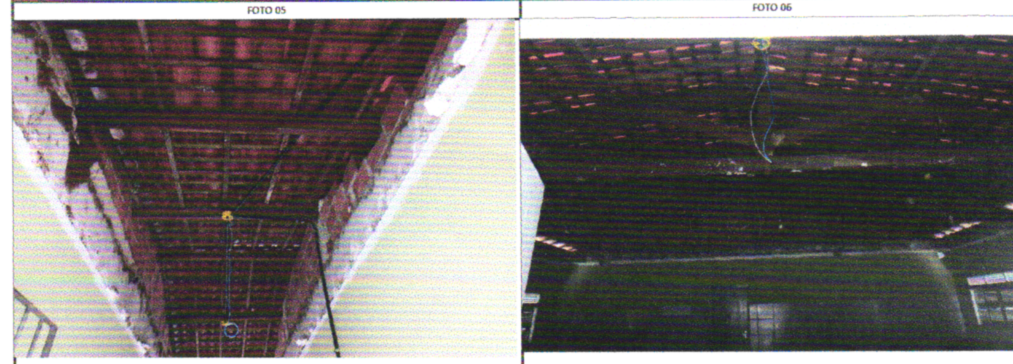
REMOÇÃO DO FORRO DE GESSO EM TODO ADMINISTRATIVO REMOÇÃO DO FORRO DE GESSO EM TODO ADMINISTRATIVO