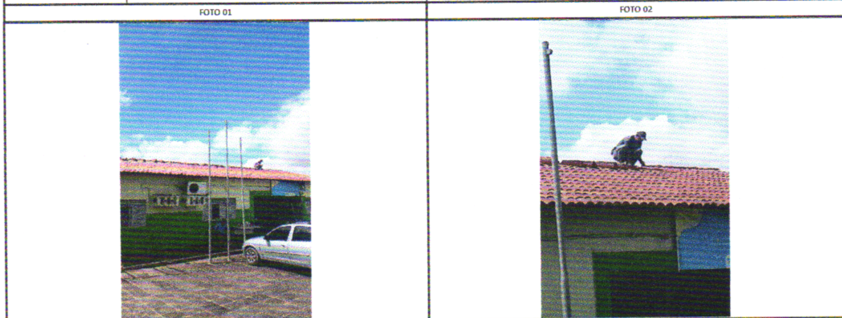
REVISÃO DA COBERTA REVISÃO DA COBERTA