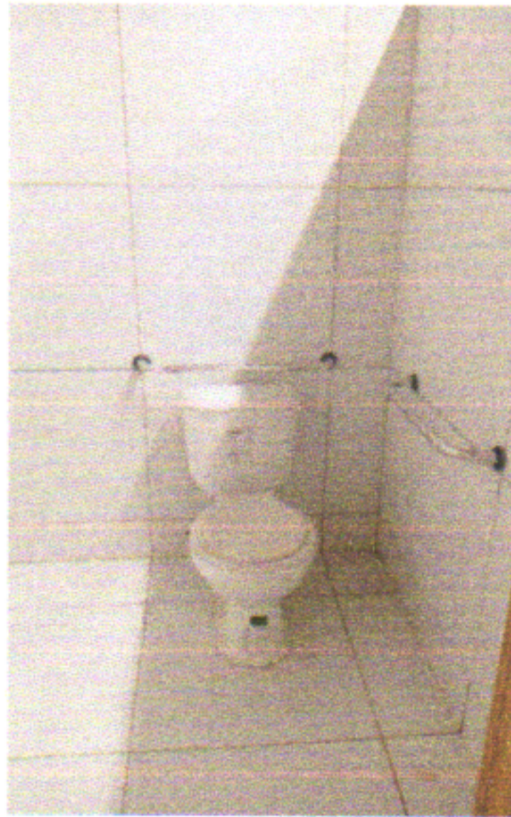
VASO SANITÁRIO COM CAIXA ACOPLADA E BARRAS DE APOIO