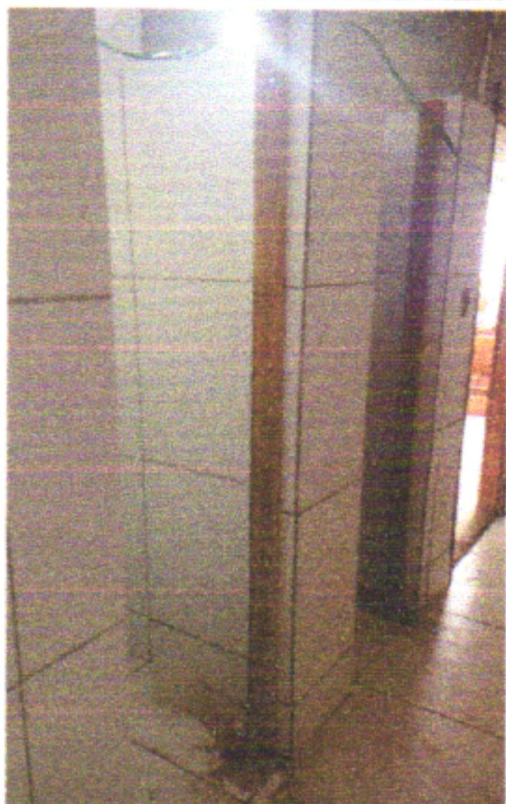
FIXAÇÃO DO BATENTE DAS PORTAS