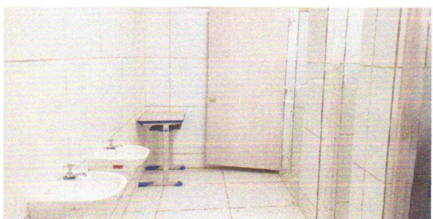
PINTURA DAS PORTAS