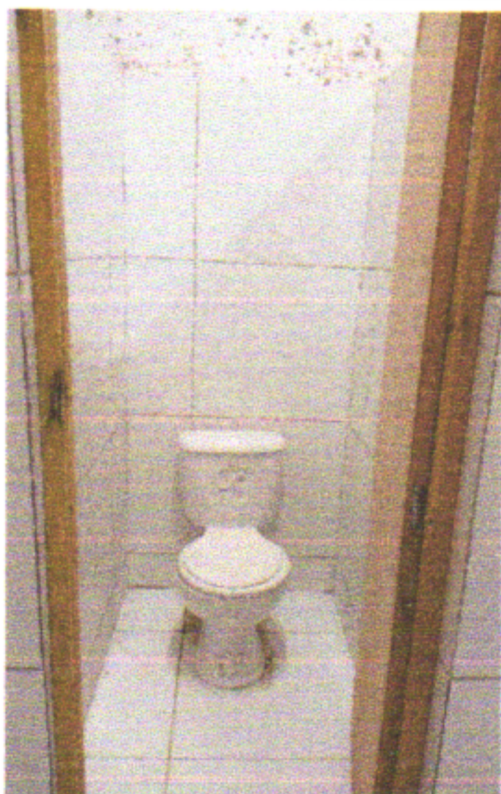
VASO SANITÁRIO COM CAIXA ACOPLADA E COLOCAÇÃO DE PORTA COM FERROLHO