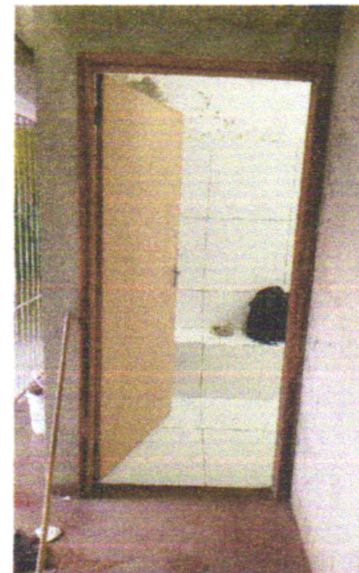
KIT DE PORTA COM FECHADURA