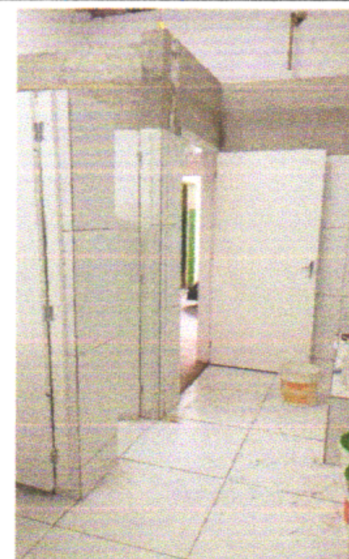
PINTURA ESMALTE NAS PORTAS