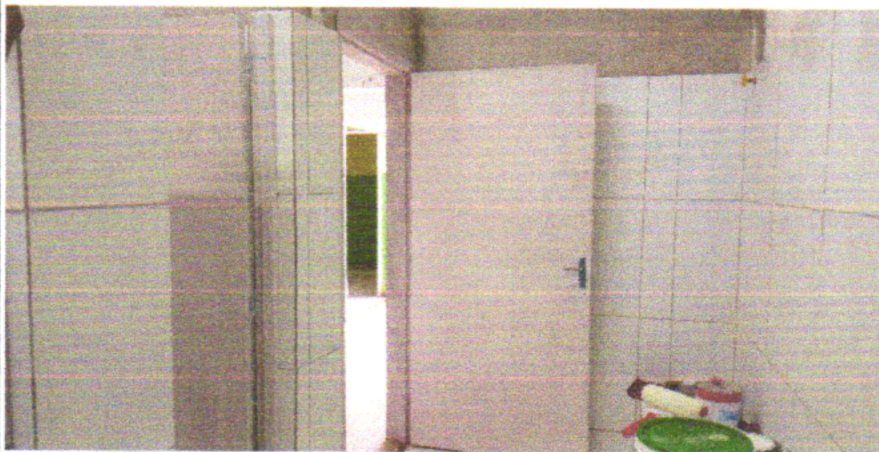
PINTURA DAS PORTAS E REGISTRO GAVETA BRUTO