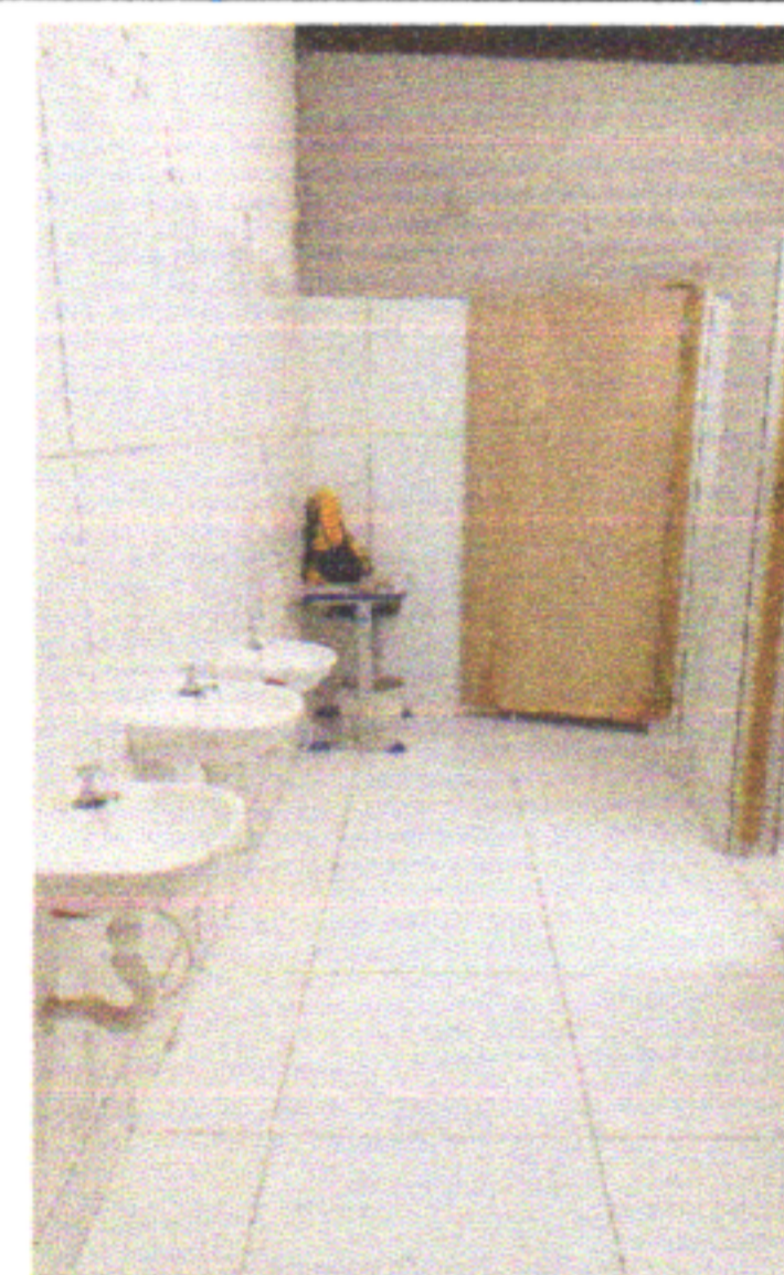
REVESTIMENTO CERÂMICO NO PISO, LAVATÓRIO, TORNEIRA, SIFÃO, VÁLVULA, ENGATE E COLOCAÇÃO DAS PORTAS COM FERROLHO