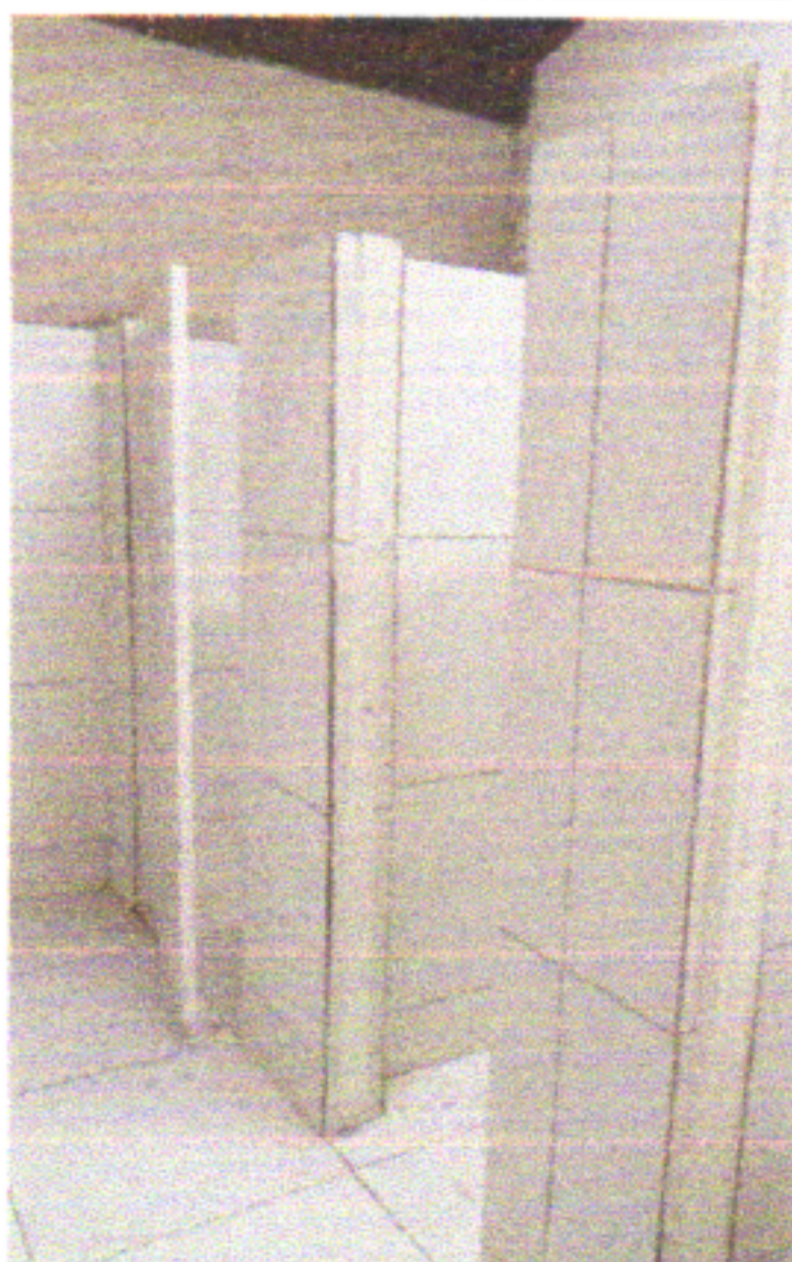
PINTURA ESMALTE NAS PORTAS