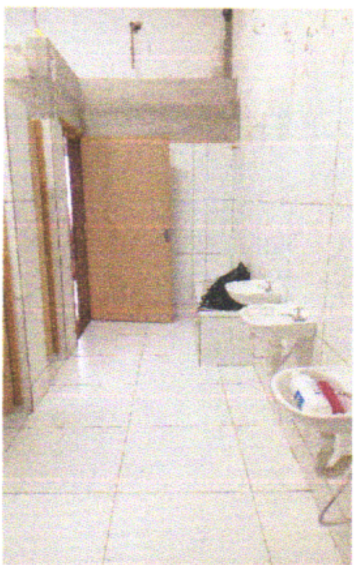
REVESTIMENTO CERÂMICO NO PISO, LAVATÓRIO, TORNEIRA, SIFÃO, VÁLVULA, ENGATE E REGISTRO GAVETA