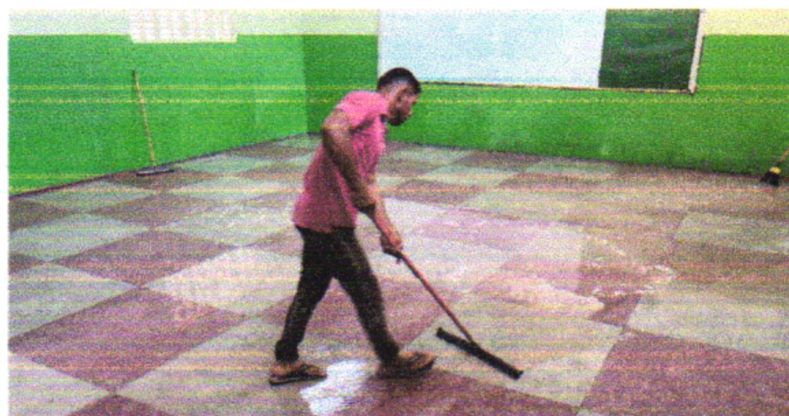
EXECUÇÃO DE POLIMENTO DE PISO GRANILITE