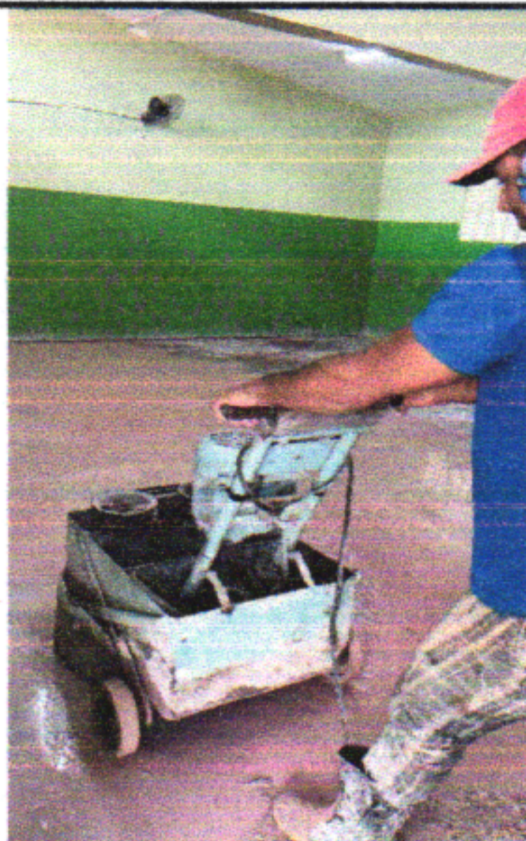
EXECUÇÃO DE POLIMENTO DE PISO GRANILITE