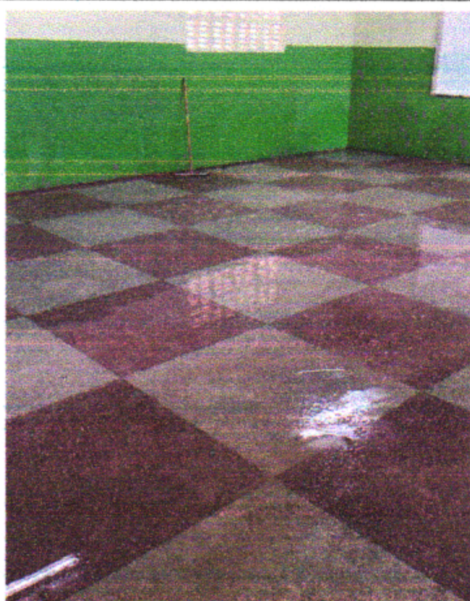
EXECUÇÃO DE POLIMENTO DE PISO GRANILITE