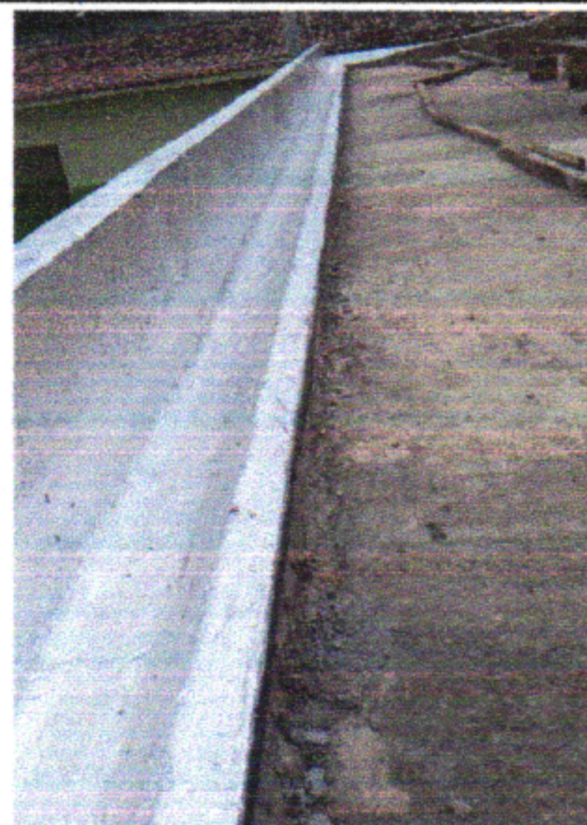
EXECUÇÃO DE SERVIÇOS DE IMPERMEABILIZAÇÃO