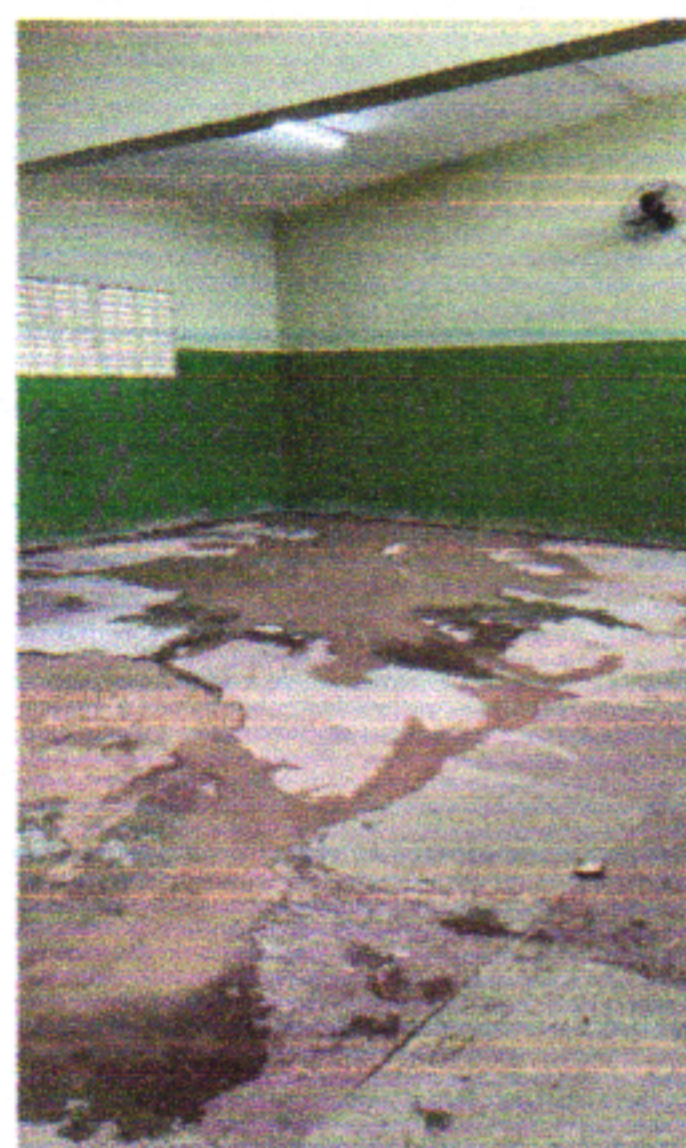
EXECUÇÃO DE POLIMENTO DE PISO GRANILITE