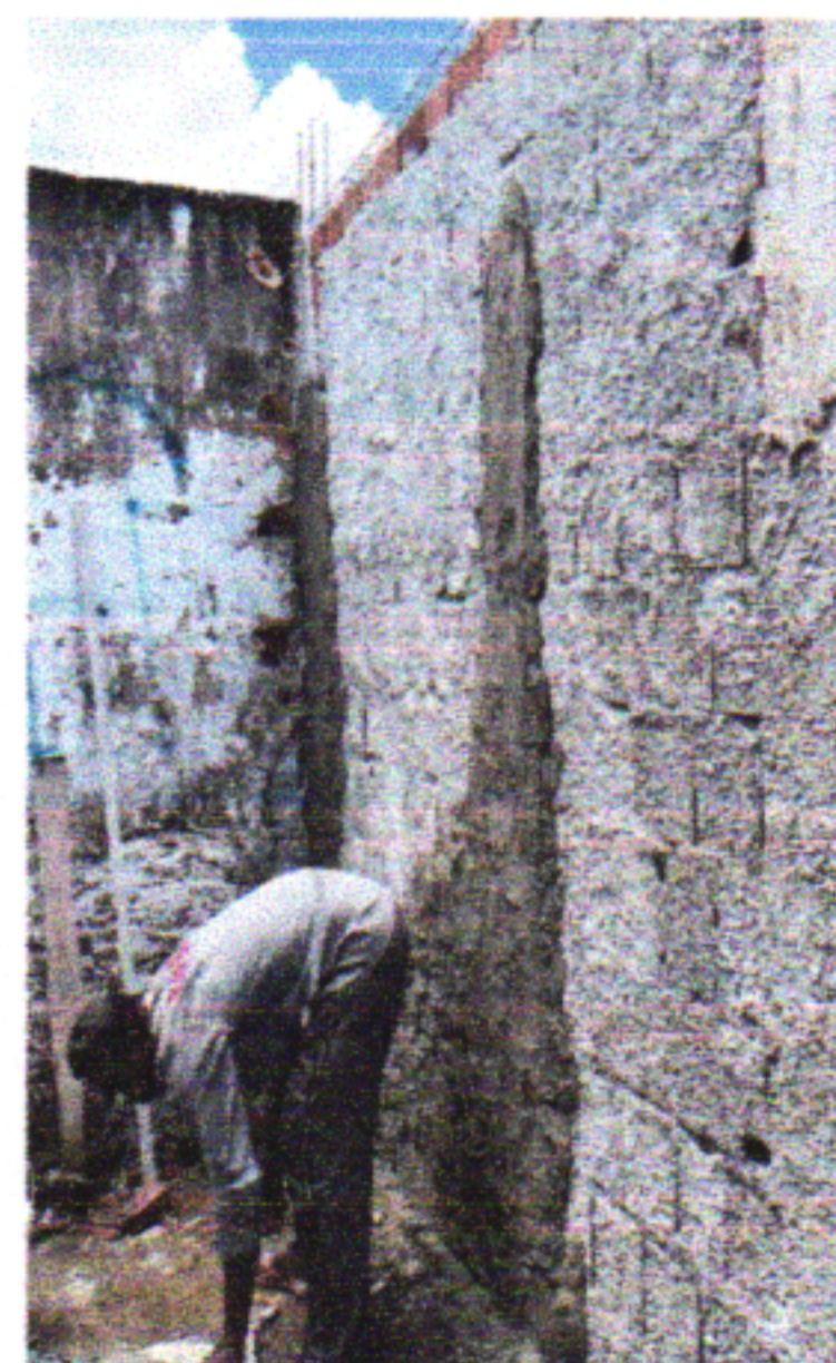
EMASSAMENTO COM MASSA ÚNICA