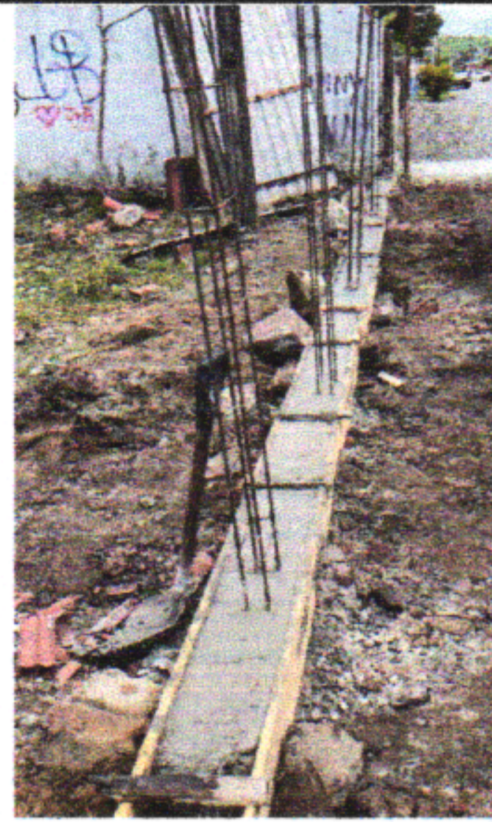
CONCRETAGEM DE CINTAS