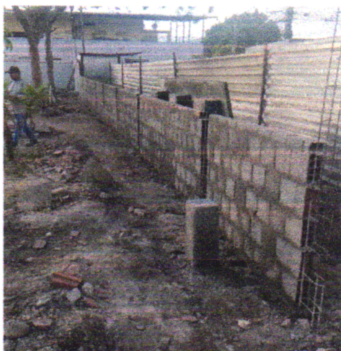
ELEVAÇÃO DE ALVENARIA COM CHAPISCO