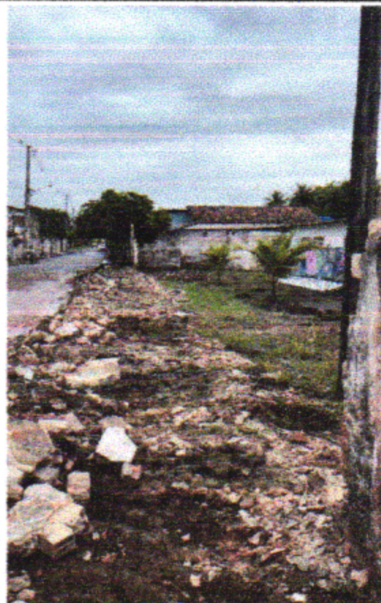
DEMOLIÇÕES DE MUROS