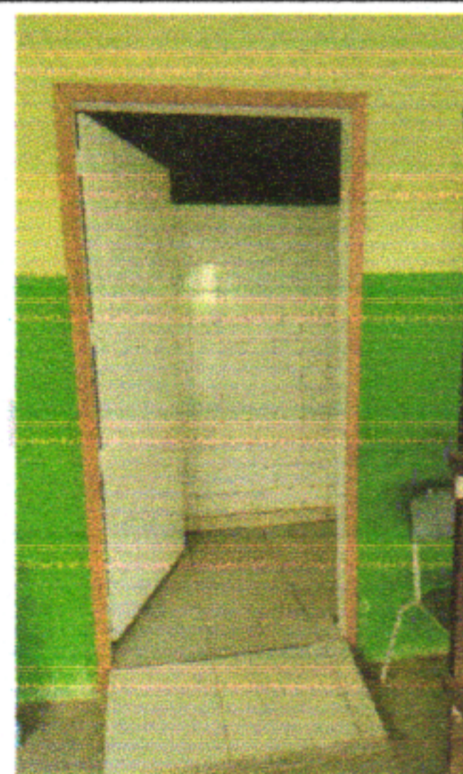
INSTALAÇÃO E PINTURA DE GRADES DE PORTA