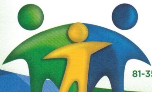
ANGELO LABANCA ALBANEZ FILHO Prefeito

São Lourenço da Mata, 06 de Abril de 2016.